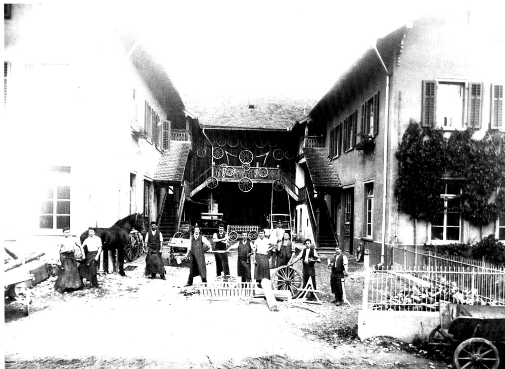
Foto: Radmacherei und Schmiede um 1900. Frage an unsere Leserinnen und Leser: Wer weiss, wo dieses Gebäude stand? – Jedenfalls nicht eingangs der Kasernenstrasse in Chur, wie man meinen möchte. Angaben nimmt gerne entgegen: P. Metz, Montalinstrasse 21, 7000 Chur.

Mario Florin: Bündner Belle Epoque in Photographien. Das Fotoatelier Lienhard & Salzborn in Chur und St. Moritz.