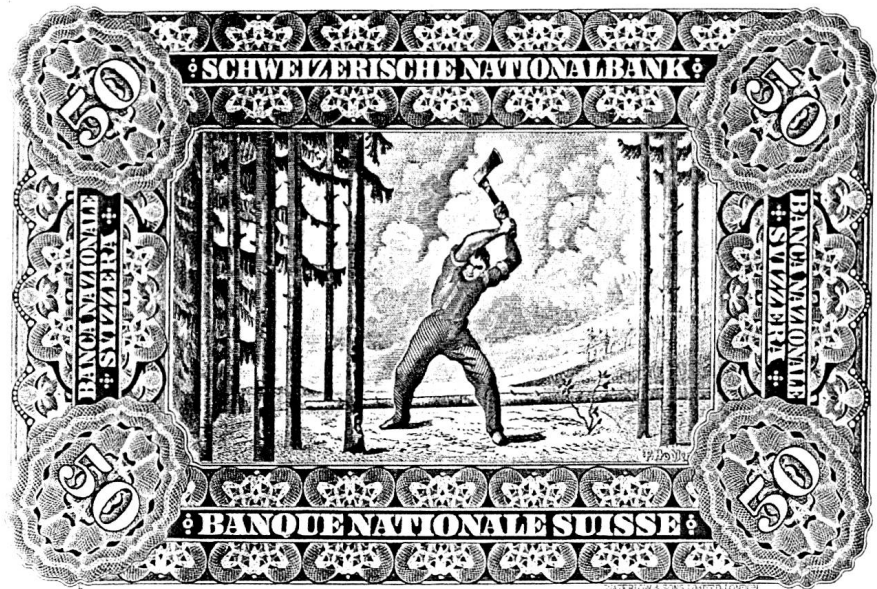
Studie zum Holzfäller von Ferdinand Hodler für die 50-Franken-Note der Schweizerischen Nationalbank, im Umlauf 1911–1958.

In der Literatur hingegen treten Bäume immer noch oder immer wieder zutage und drängen Lyriker und Erzähler zur