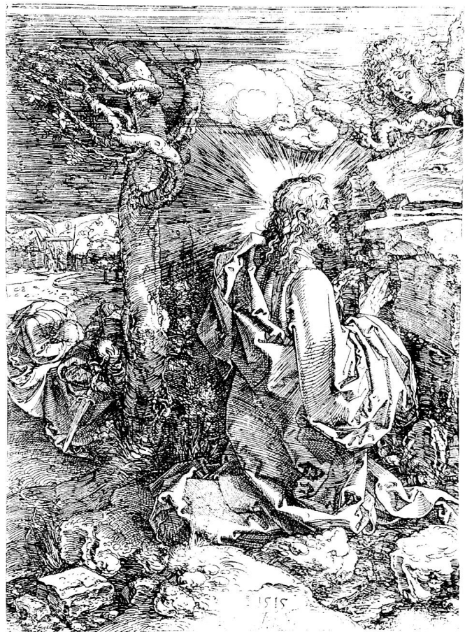
Christus am Ölberg, Albrecht Dürer 1515.

Man mag gegenüber solchen Deutungsversuchen Bedenken haben; gewiss ist aber, dass in Inhalt und Form eines künstlerischen Werkes, wenn auch verschlüsselt, sich immer die Persönlichkeit des Künstlers ausdrückt. Das ist besonders deutlich der Fall für van Goghs Schweizer Jahrgänger Ferdinand Hodler (1853–1918). Hodlers grossfigurige Gemälde mit historischem und symboli-