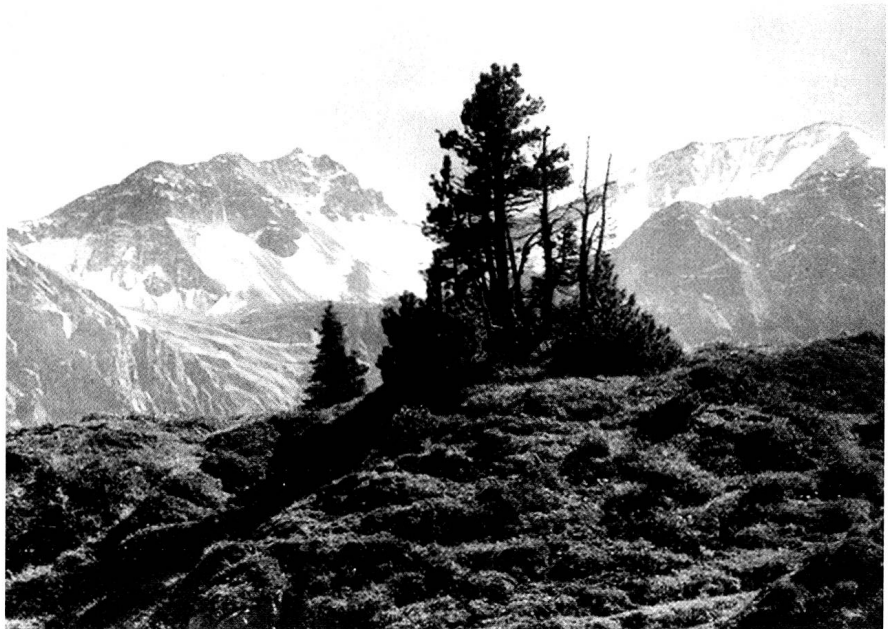
Maran bei Arosa, Blick gegen Maienfelder Furka, der Blick geleitet von C. D. Friedrichs «Der einsame Baum» von 1822.

Erlebter Eichwald und die urmenschliche Idee des heiligen Baumes sind in diesem Gedicht Hölderlins verwachsen. Die Eichen sind ihm zum Symbol geworden, dass auch der Mensch seine Anlagen frei entfalten kann. Gleichzeitig hat Hölderlin aber auch ein Bild der Gemeinschaft gefunden: ihre herrliche Grösse verdanken die Eichen der Freiheit und dem «freien Bunde», wie er es sich für Deutschland und Europa er-