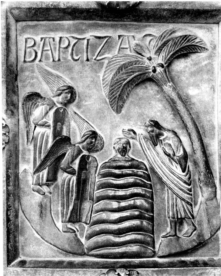
Eines von 24 Feldern in der Bronzetüre am Dom zu Pisa, geschaffen um 1180 von Bonanus.

Tradition treu. Leonardo lässt seinen Verkündigungengel vor einer bizarren dunklen Baumreihe knien, und hinter der «Heiligen Familie mit dem Distelfink» von Michelangelo korrespondieren ein paar zierliche Stämmchen mit den spielenden Kindern Jesus und Johannes. In Albrecht Dürers «Gefangennahme Christi» (aus der Holzschnittfolge der Grossen Passion von 1510) künden ein grosser gebrochener Baumstumpf und ein kräftig aufstrebender Baum die kommende Katastrophe und die Auferstehung voraus oder –