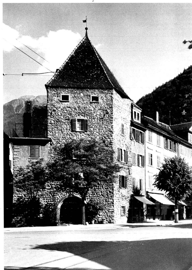
Pulverturm an der Grabenstrasse in Chur, heute Malteserturm genannt. Diente bis zum Anfang des 19. Jahrhunderts als Lager für Schiess- und Sprengpulver.

(Ansichtskarte Jules Geiger, Photohaus Waldhaus/Flims, 3.10.1939)