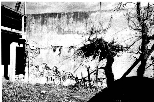
Sockel bzw. Überreste des ehemaligen städtischen Pulvermagazins am unteren Plessurkett, heute Kettweg. Nach Angaben von Frau Jeger-Hatz wurde das Magazin beim Bau der Bahnunterführung 1926 abgebrochen. (Foto: G. Schmid, 2002)

Um das Pulver bei nasser Witterung in guter Beschaffenheit behalten zu können, ist es unumgänglich nötig, dass die Stadt entweder eines ihrer Lokale längs der Strasse bis zum neuen Tor [heute Poststrasse; G.S.] dazu widme, oder ihr vor dem letzteren anführen lasse, in welchem etwa 30 Fässchen trocken aufbewahrt werden können, bis es in das Stadtmagazin abgeführt werden könne, oder verladen werde. 26