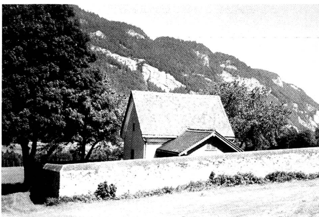
Pulverhäuschen in den Waisenhausgütern in Masans, erbaut 1835 als Pulver- und Munitionslager für die Kantonsmiliz. (Foto G. Schmid, 2002)

Die Sorge um die Sicherheit der Anwohner und die von der Militärkommission angeführten Bedenken wegen der ungünstigen Lage des Magazins führten schliesslich zum Bau der Pulverhäuschen in der Prasserie und den Waisenhausgütern. In einer «Convention» zwischen Kanton und Stadt vom 24. August 1835 ist folgendes vermerkt: