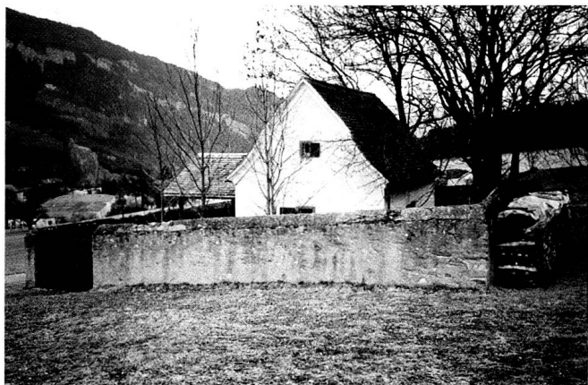
Pulverhäuschen in den Prasseriewiesen, Südansicht, erbaut 1835 als Pulver- und Munitionslager für die Kantonsmiliz.