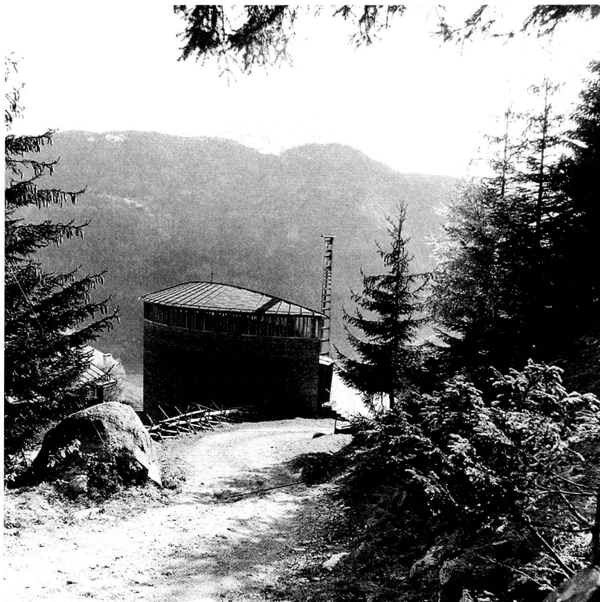
Sogn Benedetg. (Quelle: Caplutta Sogn Benedetg; Foto: Daniel Schönbächler, 1997)