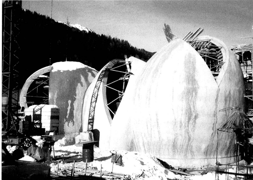
Bauruine – Baustopp, Evangelische Kirche Cazis. (Foto R. Härdi, Oktober 1996)