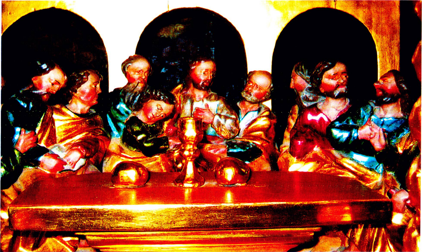
Der Tabernakel der Pfarrkirche St. Vigilius in Sedrun, die Abendmahlsgruppe.