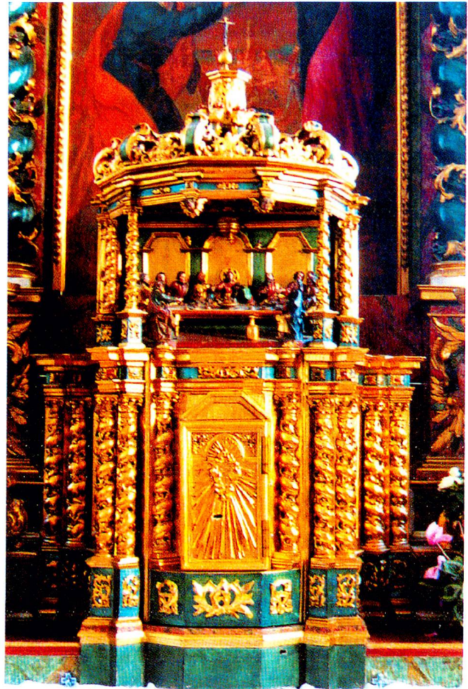
Der Tabernakel der Pfarrkirche St. Peter und Paul in Vals, entstanden kurz nach 1700, Schnitzarbeit.

Bewundernswert ist die Dichte der Darstellungen, und besonders reizvoll ist es, in diesen miniaturhaften Schnitzarbeiten besondere Einzelheiten zu beobachten: in Vals etwa den voluminösen Geldsack, den Judas mit seiner linken Hand festhält, die Weinkanne vor dem Tisch und das auf dem Rücken liegende Lamm, und in Sedrun den Kelch und die prallen Brote auf dem Abendmahlstisch, das sanfte Antlitz des Lieblingsjüngers Johannes (an der rechten Schulter von Christus) oder auch die Gestalt rechts aussen: Dieser Apostel, der aus der Gruppe herausragt, ist höchst wahrscheinlich Judas, der sich an den Betrachter wendet, als wollte er sich rechtfertigen.