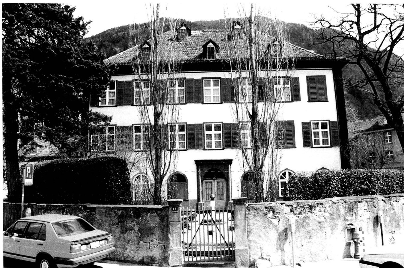
Die Westfassade mit dem Hauptportal und dem Vorgarten.

Trotzdem – und das ist das eigentlich Erstaunliche am Haus Salis auf dem Sand – begann Salis kurz nach seinem Umzug nach Chur um 1818 mit der Errichtung seines klassizistischen Repräsentations-