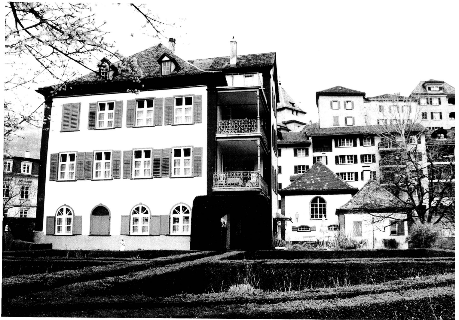
Südansicht des Hauses Salis auf dem Sand. Das Wohnhaus wird rechts vom Ökonomiegebäude und dem Wasch- und Backhaus flankiert. Im Vordergrund das Buchsparterre. (Foto M. B. 1996)