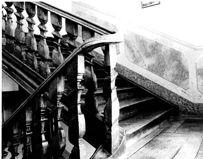
Das Treppenhaus mit barocker Balustrade und aufgemalten Marmorimitationen auf dem Absatz zwischen dem ersten und zweiten Stock.

Das Wohnhaus ist ein freistehender liegender Kubus mit sieben Fensterachsen an der westlich ausgerichteten Hauptfront und vier Fensterachsen auf den Schmalseiten. Der Ostfassade ist ein risalit-artig vorstehendes Treppenhaus vorgebaut. Der dreigeschossige Bau wird durch ein hohes zwei-