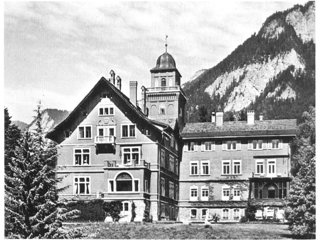
Kantonales Frauenspital Fontana, in welchem Neumünster-Diakonissen während Jahrzehnten wirkten.