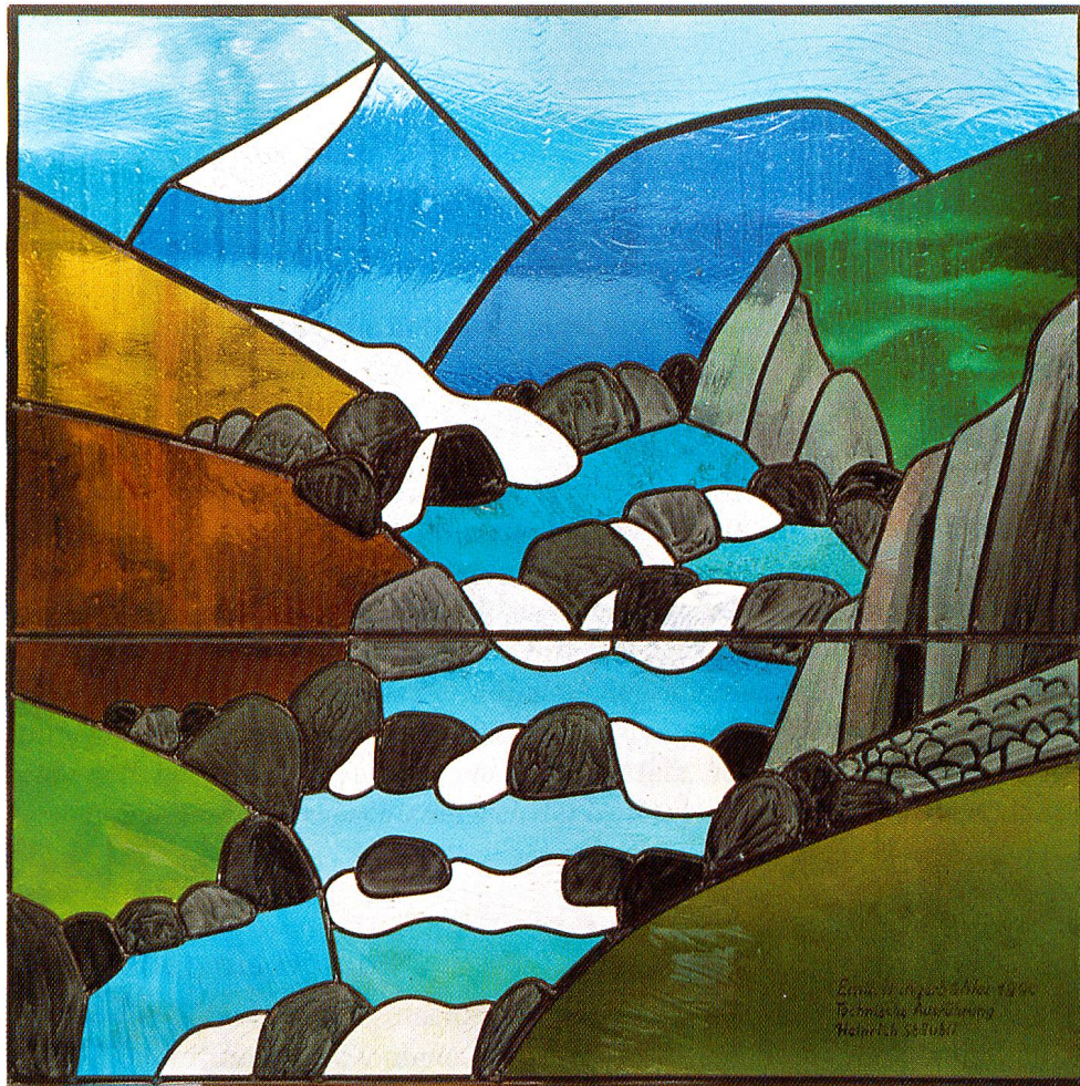
Schweizerisches Museum für Glasmalerei Romont. Ausstellung: «26 Kantone – 26 Glasgemälde 1991» Emil Hungerbühler «Graubünden» Format 80x80 cm.