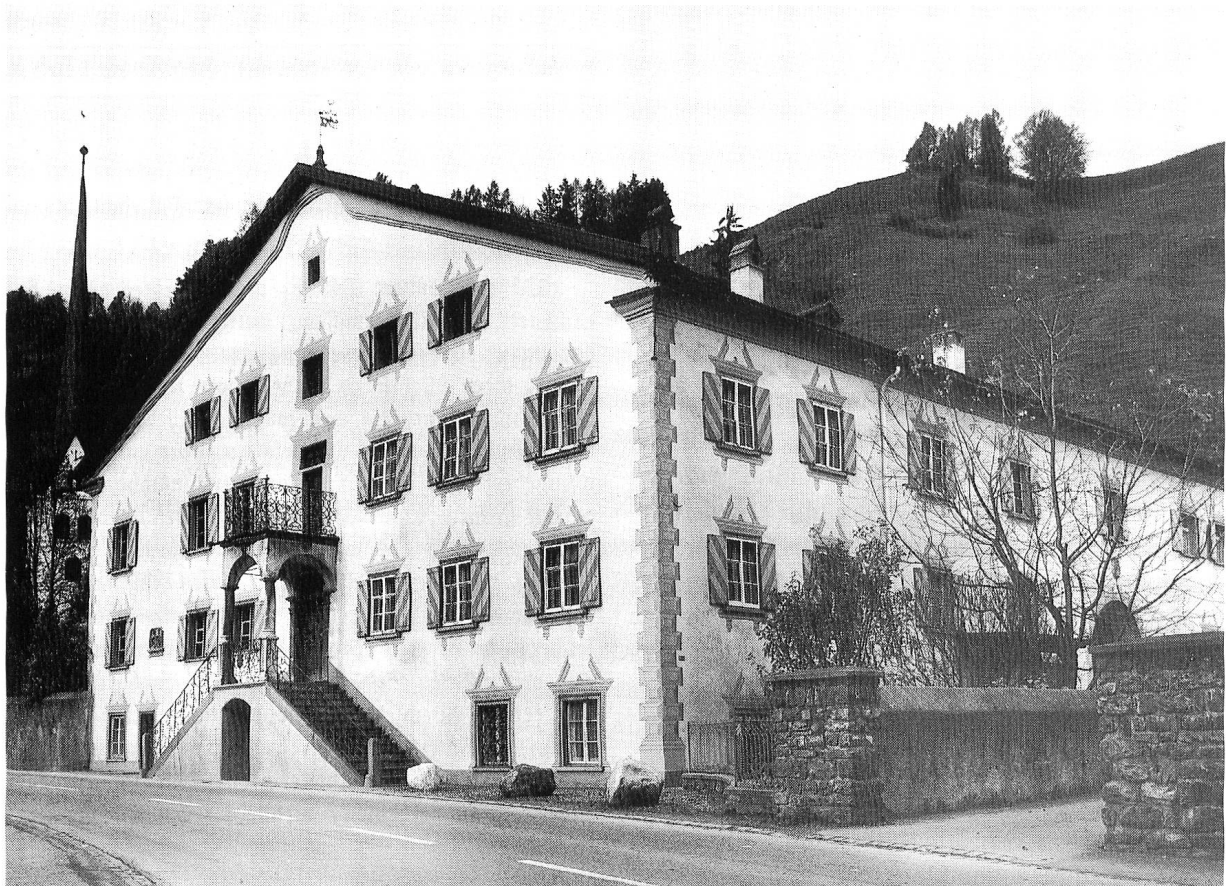
Haus zum Rosengarten in Grüşch. Sitz der Adelsfamilie v. Ott. Seit 1983 Prättigauer Heimatmuseum.