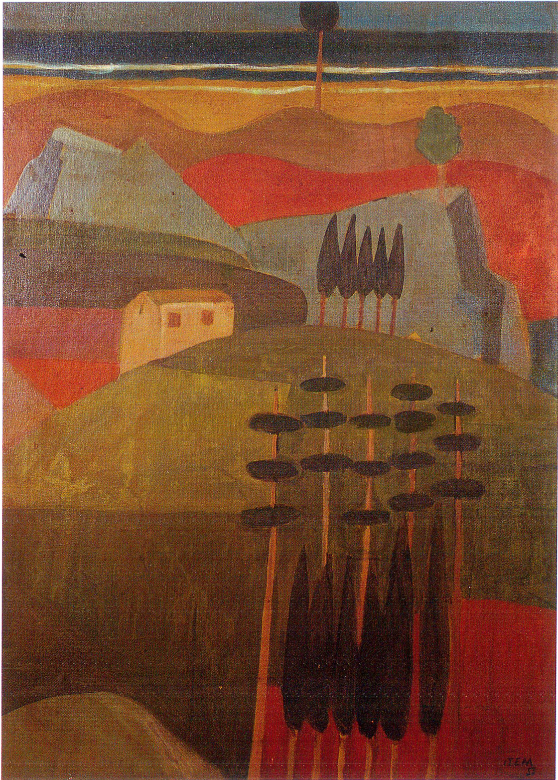
Georges Item: L'Hermitage, 1951, Wachsmalerei.