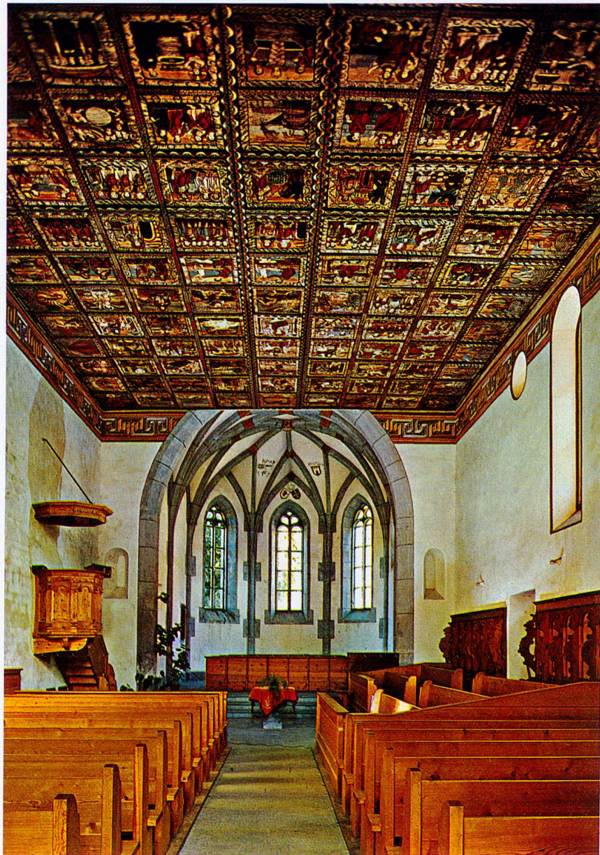
Kirche Zillis: Blick gegen Chor