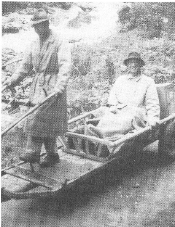
Transport von Eugen Jochum mit verstauchtem Fuss vom Haus Mengelberg in Zuort durch die Schlucht nach Hotel Val Sinestra, Sommer 1958.