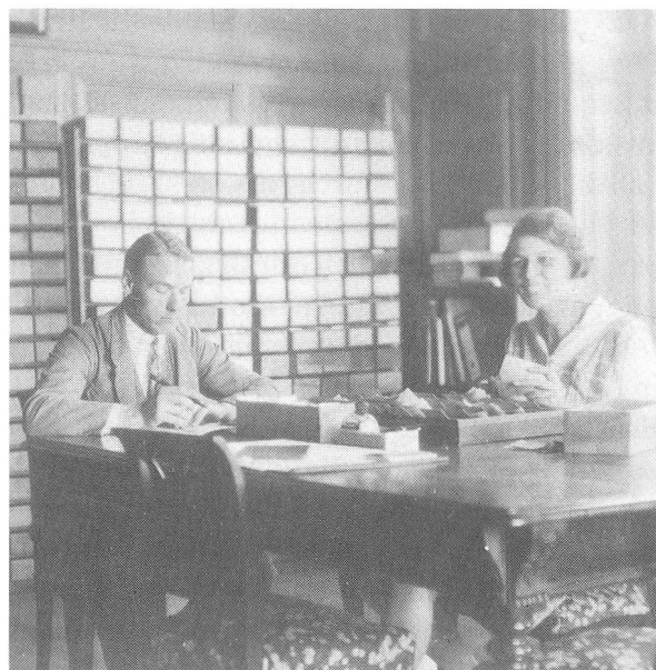
«Namenbuchzimmer» direkt über der Eingangshalle.

Mit Fürstenuau blieb ich während der ersten drei Semester dauernd in engem Kontakt und verbrachte dort auch die Semesterferien. Während dieser Zeit erkannte ich, dass die Aufgabe, vor der der inzwischen 67 Jahre alt gewordene Autor des Namenwerkes stand, seine Kräfte bei weitem überfordern müsste. Nach reiflicher Überlegung entschloss ich mich, ihm nahezulegen, seinen noch kaum durchdachten Plan, den bündnerischen Namenschatz in eine Rätische Siedlungsgeschichte einzubauen, neu zu überdenken und zunächst die Veröffentlichung des gesamten gesammelten Stoffes in einem Materialband ins Auge zu fassen. Ich entsinne mich heute noch lebhaft der Wirkung, die dieser Vorschlag auslöste. Wir empfanden beide eine solche Lösung als die einzig richtige. Die Verzettlung der nach Gemeinden geordneten Nameninventare und deren Umordnung in ein etymologisches Onomastikon wurde gestoppt. Dafür entstanden alphabetisch geordnete maschinengeschriebene Flurnameninventare (Listen) für jede Gemeinde, welche noch im Laufe des Frühjahrs 1931 an geeignete Gewährsleute im ganzen Kanton zwecks Korrekturen und Ergänzungen versandt wurden. Eine gewisse gedrückte Stimmung, die sich unser bemächtigt hatte, wich weitgehend. Wir glaubten wieder zuversichtlich an die Vollendung wenigstens eines guten Teils des Werkes noch bei Lebzeiten des Begründers.