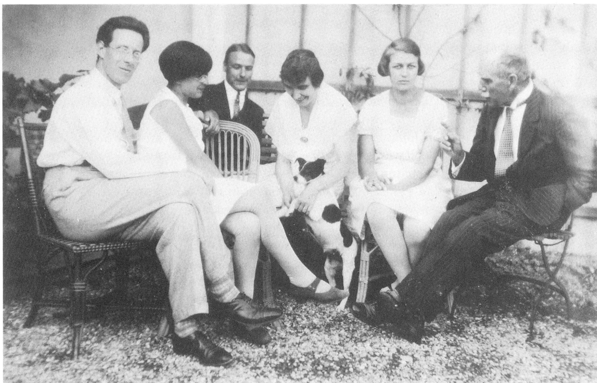
Auf der Terrasse. Links Eugen Jochum und Frau.