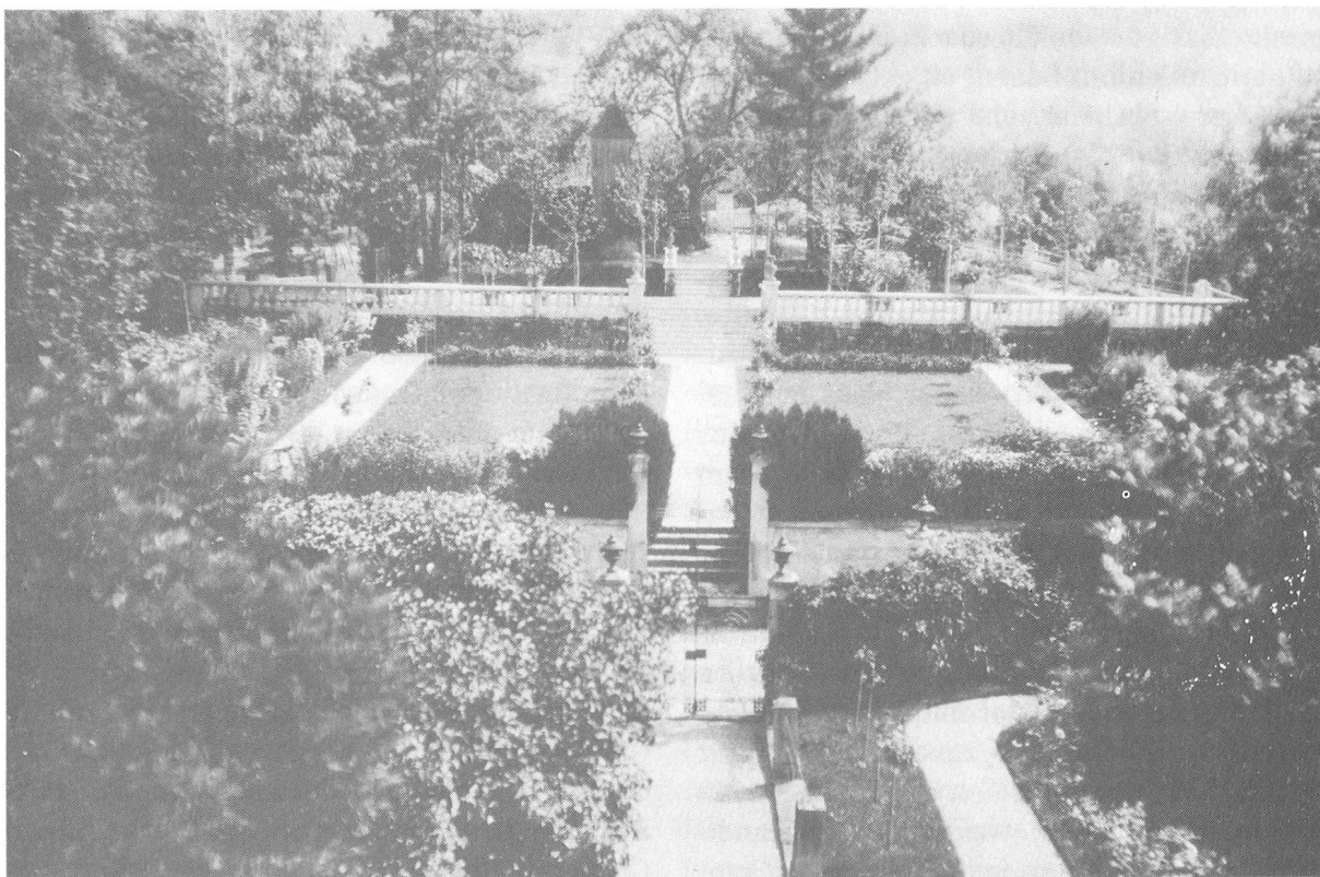
Gartenanlage ausgeführt nach Vorschlag von Prof. Heinrich Wölfflin. Von der Schlosstreppe aus gesehen.

dorfer, Klaräpfel u.a. So lernte ich bald auch, mit Baumschere, Pfropfmesser, Baumwachs und Bast umzugehen. Von grossem Erfolg war mein Wirken nicht gekrönt, aber Herr Doktor, wie man ihn im Dorf und im Schloss nannte, hat darüber nachsichtig hinweggesehen. Sein Hauptanliegen bei solchen Pfropfkaktionen war die Erhaltung der nach seiner Meinung im Tal heimatberechtigten alten Apfelsorten. Er bedauerte den Rückgang verschiedener Lederäpfel, der Suuracher, der Blauacher und der Achacherer, Rambouren und der für Apfelschnitt so geschätzten Usteräpfel, die der Gärtner auch Chridebüchslar nannte. Er hatte einen Obstgartenplan, in den die Bäume eingetragen waren, neben den genannten auch die bekannten Grafensteiner, Goldparmänen, die Berner Rosenäpfel, die Danziger Kantäpfel, Ananasreinetten usw. Aber auch den Birnen und dem Steinobst galt seine Liebe. Es gab da einen eigentlichen «Zwetschgenbongert», wo auch Pflaumen, Palogen, Palögli, Renekloden