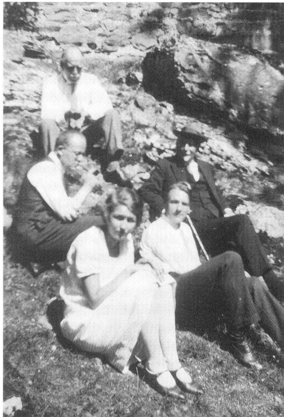
Ausflug nach Hohenrätien, kurze Rast in der schattigen Ruine. Rechts hinten Prof. Heinrich Wölfflin.