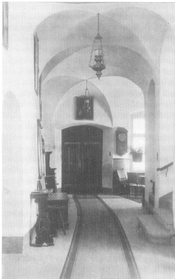
Halle, Blick gegen die Haustüre, hinten rechts Ausgang zur Terrasse.

Mahlzeiten waren abwechslungsreich und schmackhaft, aber einfach, selbst dann, wenn Gäste mit uns assen. Der Hausherr liebte die bürgerliche Kost, Mehlspeisen, Reis und Griesklösse, sowie Gemüse, Dörr- und Frischobst, auch Spargeln, alles aus dem eigenen Garten. Sogenannte Festessen waren ihm fremd.