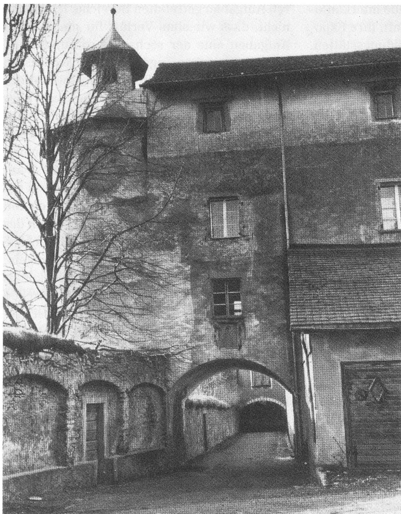
Kopfende des Nordtraktes von Schloss Haldenstein. Deutlich erkennbar ist das nach dem Brand von 1732 aufgesetzte dritte Geschoss, das der Schülerschaft des Seminars Haldenstein als Schlafgemach diente. In den unteren Stockwerken fand der Unterricht statt.

ses Haldenstein. Manches Thema liesse sich in Form von Kontrasten aufarbeiten: Knaben- und Mädchenbildung, privates, kirchliches und staatliches Bildungswesen, Lese- und Schreibmethoden im Verlaufe der Geschichte. In anderen Ausstellungen könnte das vielfältige Verhältnis der Schule zur gesamten Kultur betrachtet werden, etwa die Schulpflicht im Verhältnis zur Arbeit, speziell der Kinderarbeit – man denke zum Beispiel an die Schwabengängerei, die einer Verlängerung der Schulzeit viele Jahrzehnte im Wege stand – oder die Schule als Gesellschaft verändernde bzw. sie erhaltende Institution.