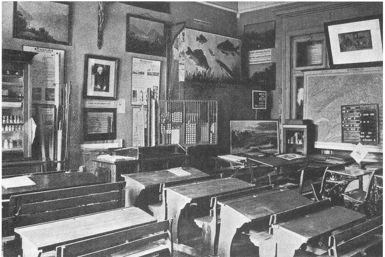
Modellschulzimmer im Musée Pédagogique de Fribourg

lien in Kenntnis zu setzen. 1889 wechselte diese «Exposition scolaire» ihren Namen in « Musée Pédagogique » und richtete neu einen Verleih ein. Besondere Aufmerksamkeit widmete das Museum dem Sichten der Werke des bedeutenden Freiburger Pädagogen und Paters Gregor Girard (1765–1850).