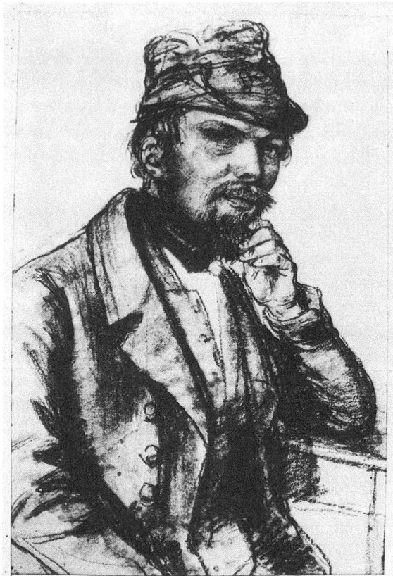
Selbstbildnis Martin Disteli, um 1840

So schön der Willkomm der Städte, so innig war der Gruss des Landes; wohl munter stimmten die Festgelage, herrlich donnerten die Kanonen; es imponierten die bewaffneten Geleite und feierlich strahlten die Illuminationen – aber die