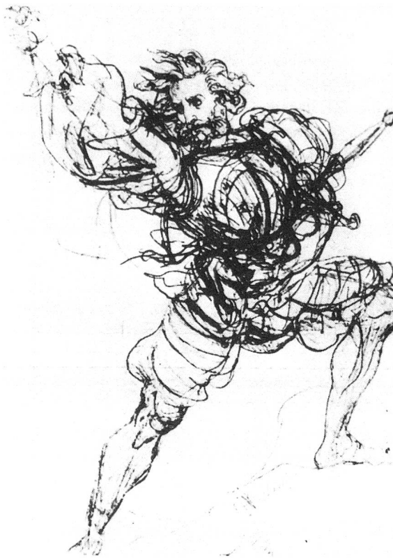
Benedikt Fontana, 1841

Die Gründung unseres Bundestaates, die Bundesverfassung von 1848, auf welche in Chur 1842 in so vielen Varianten dringlich angespielt worden war, mitzuerleben war Disteli nicht mehr vergönnt. Nach seinem Hingang aber zeigte sich's immerhin in überwältigender Weise, wie sehr ihn manche Mitbürger geschätzt hatten. «Als die Leiche des Malers Disteli nach Olten abgeführt wurde», stand im Solothurner Blatt vom 23. März 1844 zu lesen, «erhielt sie ein Ehrengeläute durch die Stadt Solothurn, wie man seit langem nichts Ähnliches gesehen. Als Zeichnungslehrer geleiteten ihn die Studenten und Professoren, als Oberstleutnant an die dreissig Offiziere; zwölf Freiwillige aus seiner Grenadierkompa-