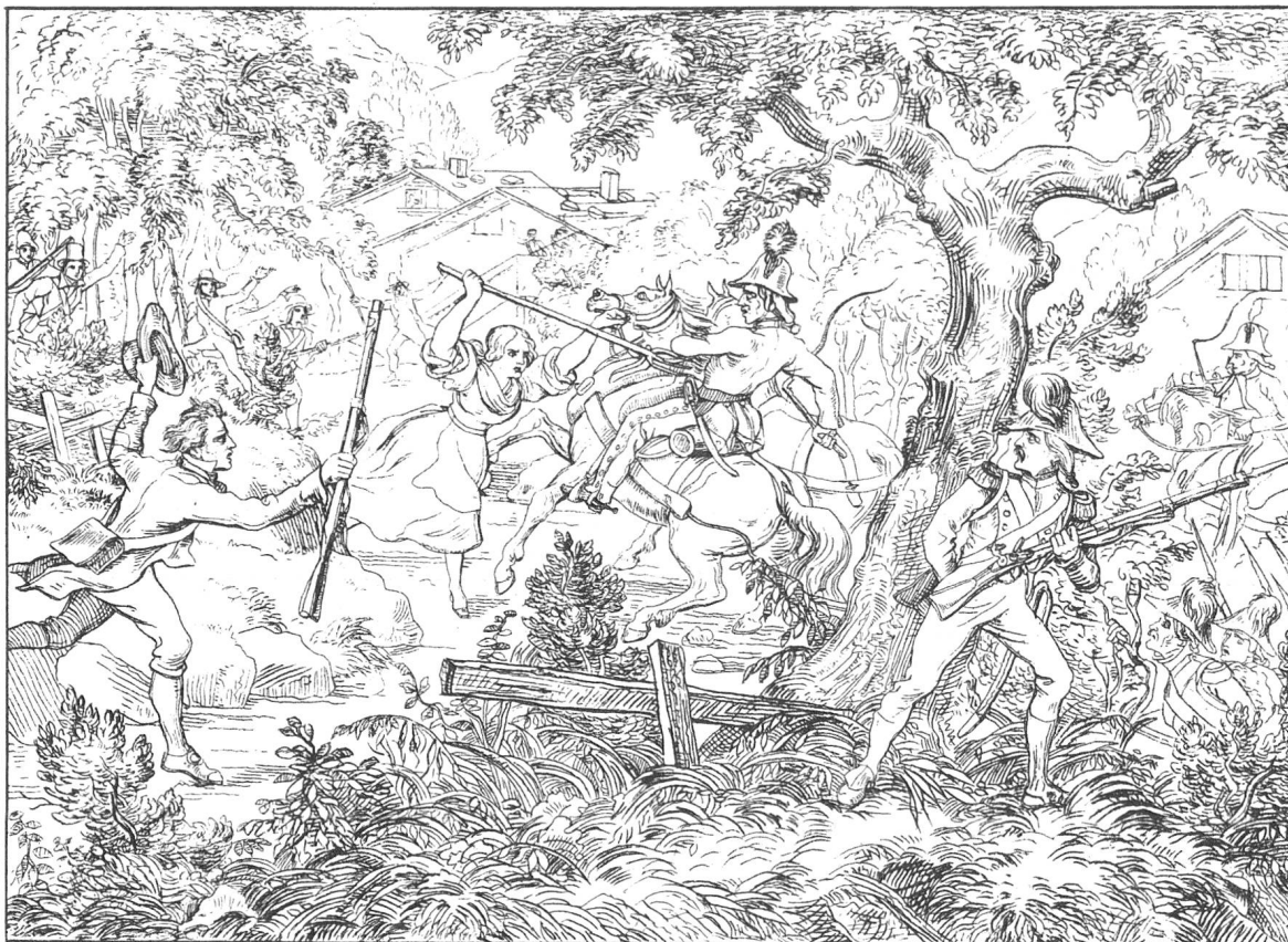
Das kühne Bündner-Mädchen