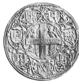
Patenpfennig um 1547