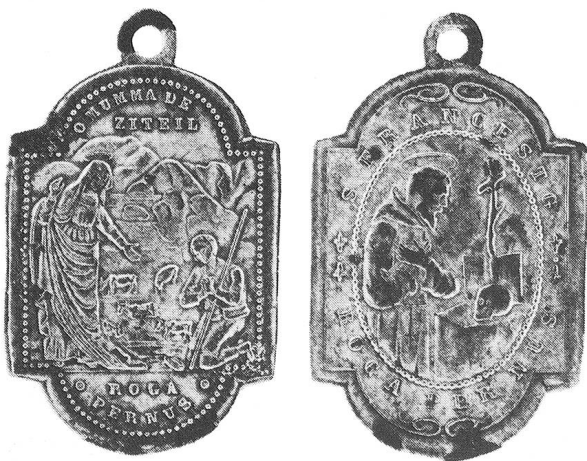
Wallfahrtsanhänger 20. Jh.

schneider für grosse und kleine Münzen verschiedener Kantone, als Siegelstecher für Zürcher Familien, als weit über die Grenzen seiner engeren Heimat hinaus beehrter Fachmann für Münzangelegenheiten, war Zunftmeister zur Kämbel, Ehe- und Zinsrichter, Landvogt in Wädenswil. Am berühmtesten ist er aber als ältester und einer der besten Medailleure der Schweiz geworden. Seine Medaillen, deren Modell er in