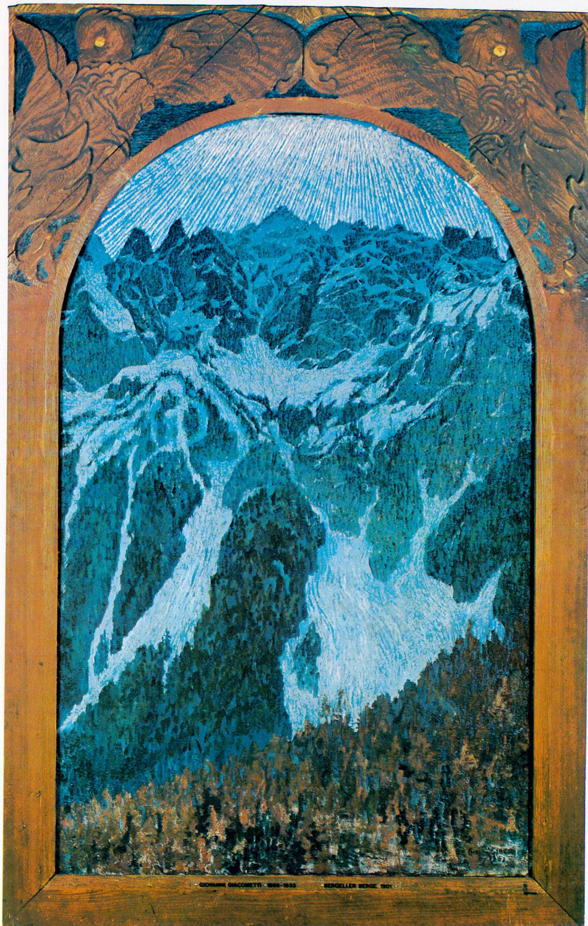
Giovanni Giacometti: Bergeller Berge, 1901. Öl auf Leinwand. 137,5 x 86,5 cm Bündner Kunstmuseum, Chur