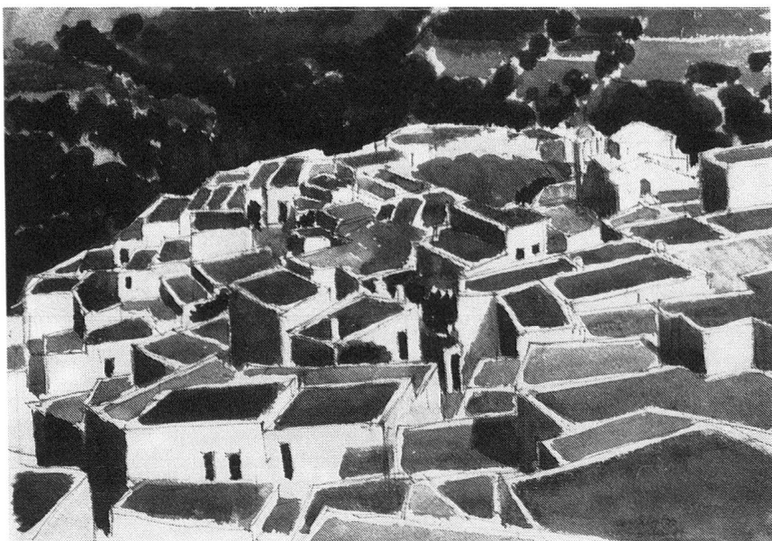
Emil Hungerbühler: Skyros, 6. Juni 1981, Aquarell, 39 x 54 cm.

geschaffen hast, ist frisch und lebendig. Du läßt Dich von neuartigen Motiven überraschen, packst oft geradezu unbekümmert zu und bist weit davon entfernt, ein theoretisierender Grübler und Rechtshaber zu werden oder Deine Motive zu filtern und zu stilisieren, bis vom ur-