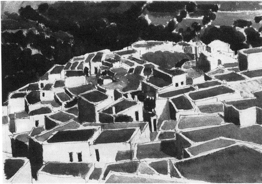
Emil Hungerbühler: Skyros, 6. Juni 1981, Aquarell, 39 x 54 cm.

geschaffen hast, ist frisch und lebendig. Du läßt Dich von neuartigen Motiven überraschen, packst oft geradezu unbekümmert zu und bist weit davon entfernt, ein theoretisierender Grübler und Rechthaber zu werden oder Deine Motive zu filtern und zu stilisieren, bis vom ur-