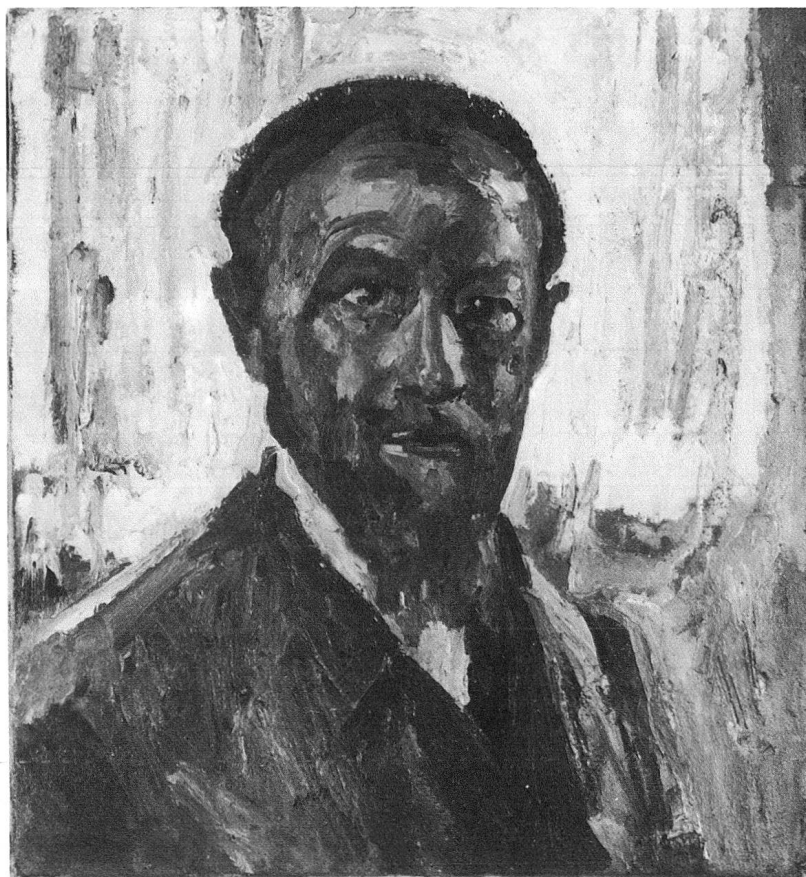
Giovanni Giacometti: Selbstbildnis. Um 1916. Öl auf Leinwand. 50 x 46 cm.

Wie in der Einleitung festgehalten wird, erlauben es die 32 Gemälde der Bündner Kunstsammlung, ein Miniature einen Überblick über die Entwicklung des Gesamtwerks von Giovanni Giacometti zu gewinnen. In knappem Zeitraffer läßt sich da etwa die Anlehnung an Segantini'sche Kunst beobachten und deren Überwindung. Bindeglied zwischen den beiden Künstlern ist das Bild «Die beiden Mütter», das laut Inschrift 1899 von Segantini begonnen und 1900 von Giacometti vollendet wurde. Aber auch mit seinem «Panorama von Muottas Muragl» (1897/98) und den «Bergeller Bergen» (1901) ist Giacometti noch ganz der Auffassung des Älteren verpflichtet. Interessantes Schlüsselbild ist «Mutter und Kind unter Blütenbaum» vom Jahre 1900, bei dem sich schon deutlich ein Aufbrechen in eigene Formfindung und Ikonographie erkennen läßt. Das Bild ist zwar noch im dichten, feinen Strichelgespinnst Segantinis gemalt, das tiefleuchtende Blau des Himmels holt jedoch schon zu geschlossener Flächenwirkung aus. Der Schatten zeichnet sich am Zaun als unruhiges Sonnengeflecke ab: Die Nahwirkung des Sonnenlichtes beginnt zu interessieren. Inhaltlich ist das Bild eine Vorwegnahme der Kinderbilder, die Giacometti mit der Geburt und dem Heranwachsen seiner eigenen vier Kinder in Stampa malte. In jener Reihe ist 1909 der «Stehende Mädchenakt auf Wiese» entstanden, die fünfjährige Tochter Ottilia, die nackt auf einer Wiese steht, den rechten Arm an den Kopf verschränkt. Kopf und Haare sind