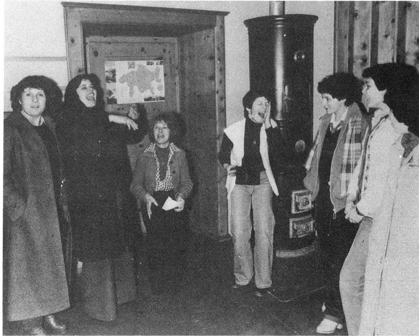
Babania Ardez Verlosung der Paare

los und natürlich ihre Liebe finden sollen. Da werden heißer Talg oder heißes Blei in kaltes Wasser geworfen. Die oft bizarr verformten Stücke, in denen mit einiger Phantasie bestimmte Bilder, Formen oder Symbole zu erkennen sind, werden von einer alten Frau, einer Weissagerin – die es natürlich nicht zu allen Zeiten gibt – gedeutet. Anschließend folgt der «Tanz der Roten Röcke – Il bal da la schocca cotschna», an den sich selbst alte Ardezer mit Vergnügen erinnern. Es herrscht die ersten vier oder fünf Runden absolute Damenwahl. Nicht nur, daß die Schönen in ihrer sattroten Engadiner Tracht wählen dürfen – nein, sie müssen. Aber sie müssen nicht einen Burschen, sondern ein Los wählen oder ziehen. Und da kommen oft die heitersten Vereinigungen zustande. Daß zum Beispiel eine zierliche Jungfrau mit einem klobigen Bauer oder Knecht von dreißig Jahren tanzen muß. Maximum des Festes: wenn sich später herausstellt, daß sich an Babania tatsächlich ein Lebenspaar gefunden hat. Babania ist das größte Fest des Dorfes und ein wichtiger Beitrag im Sinne guten Zusammenlebens.»