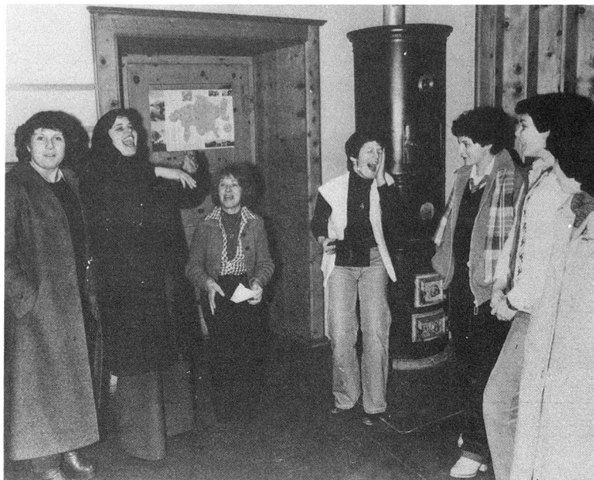
Babania Ardez Verlosung der Paare

los und natürlich ihre Liebe finden sollen. Da werden heißer Talg oder heißes Blei in kaltes Wasser geworfen. Die oft bizarr verformten Stücke, in denen mit einiger Phantasie bestimmte Bilder, Formen oder Symbole zu erkennen sind, werden von einer alten Frau, einer Weissagerin – die es natürlich nicht zu allen Zeiten gibt – gedeutet. Anschließend folgt der «Tanz der Roten Röcke – Il bal da la schocca cotschna», an den sich selbst alte Ardezer mit Vergnügen erinnern. Es herrscht die ersten vier oder fünf Runden absolute Damenwahl. Nicht nur, daß die Schönen in ihrer sattroten Engadiner Tracht wählen dürfen – nein, sie müssen. Aber sie müssen nicht einen Burschen, sondern ein Los wählen oder ziehen. Und da kommen oft die heitersten Vereinigungen zustande. Daß zum Beispiel eine zierliche Jungfrau mit einem klobigen Bauer oder Knecht von dreißig Jahren tanzen muß. Maximum des Festes: wenn sich später herausstellt, daß sich an Babania tatsächlich ein Lebenspaar gefunden hat. Babania ist das größte Fest des Dorfes und ein wichtiger Beitrag im Sinne guten Zusammenlebens.»