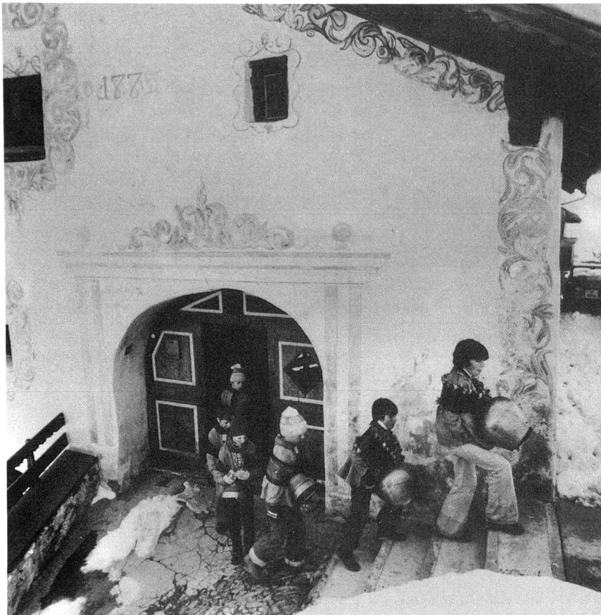
Guarda Chalanda Marz

«Peitschengeknalle und Kuhglockengeläute erfüllen die Dorfgassen – der Winter wird ausgetrieben. Allen voran Sennen und Hirten, mit blauen Kutten, roten Halstüchern und mindestens einer Großvaterpfeife. Je lauter, desto besser, von Haus zu Haus, um Geld für die Schulkasse zu sammeln. Auf den Dorfplätzen werden Frühlingslieder gesungen. Und schließlich wird mit dem Geld der turbulente «Chalandamarz-Ball» gefeiert. Für die höheren Klassen dauert es meistens bis spät in die Nacht. Der Chalanda-marz-Brauch wurde durch Selina Chönz und Alois Carigiet im «Schellenursli» festgehalten. Dieser Brauch lebt fast überall dort, wo die Faschnachtstradition fehlt.