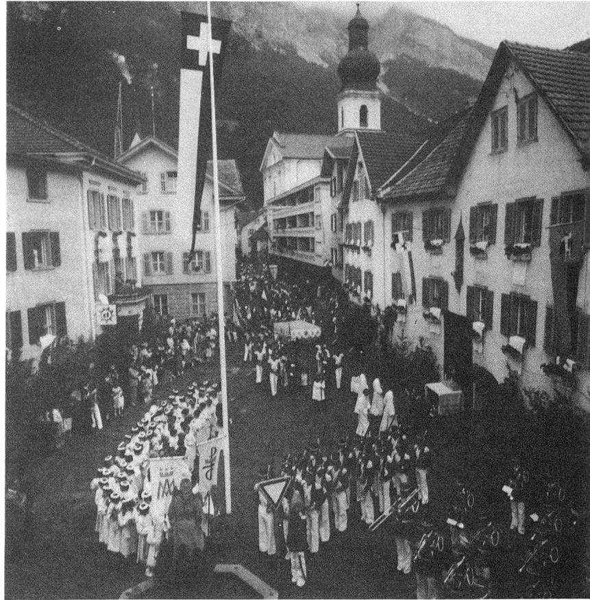
Fronleichnam in Domat/Ems

bin überzeugt, daß solche Theaterdarbietungen einen Riesenzulauf erleben und daß die Darsteller, Handwerker und Bauern, von einem ungelerten Laienregisseur geleitet, sich einem leidenschaftlichen Pathos ergeben, das diesem Volke lateinischen Geblüts angeboren ist und deshalb gar nicht unnatürlich wirkt.