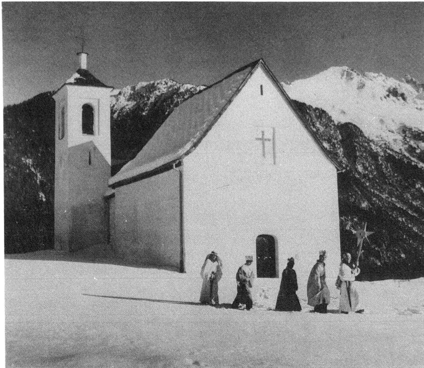
Die Kapelle des Weilers Del Oberhalbstein Die Sternsinger von Salouf ziehen vorbei.

meln und Trompeten statt. Angeführt vom Tambourmajor marschieren Tambouren und Musikanten längs bestimmter Routen durchs Dorf; Buben und Mädchen gehen in Scharen voraus; sie müssen erst nach dem Zapfenstreich nach Hause gehen. Diese Festouvertüre hebt die Gemüter der Bevölkerung über den Alltag hinaus...An verschiedenen Stellen des Dorfes wird Tagwacht geblasen. Für die Bewohner an der Route der Prozession heißt es nun aufstehen und Vorbereitungen treffen. Die Häuserfassaden werden mit Buchenästen oder Tännchen verkleidet. An verschiedenen Stellen werden Kränze aus Tannenzweigen über die Straße gespannt. Es werden vier Altäre errichtet. Während des ersten Gottesdienstes wird der Prozessionsweg mit frischem Gras bedeckt.