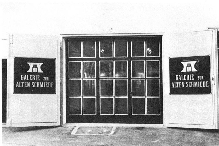
Galerie «Zur alten Schmiede» in Thusis