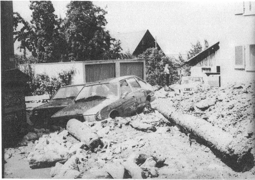
Das richteten in Trimmis Schlamm, Geröllmassen und Holzstämmen an.

sich in Trimmis und besonders in Molinis verheerend aus.