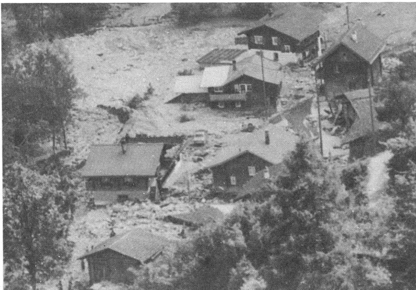
So katastrophal sah es nach dem Rüfegang in Molinis aus.

Noch viel schlimmer ging es in Molinis zu und her. Ein innert Minuten zu einer reissenden Rüfe angeschwollener Seitenbach aus dem Fatschazertobel durchbrach Wuhrbauten und schoss mit ungebändigter Wucht auf das Dorf zu. Schlamm und Steine überschwemmten Häuser und Ställe. Durch ein Fenster drang das Geschiebe in die Kirche, staute