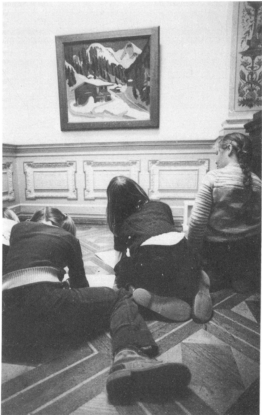
Zeichnende Schüler in der Kirchner-Ausstellung

In unserem Kunstmuseum war vom 18. 5. – 15. 6. 1980 eine Wanderausstellung zu Gast, die TELEFONZEICHNUNGEN von drei arrivierten Künstlern präsentierte. Franz Eggenschwiler , Alfonso Hüppi und Dieter Roth , geistig