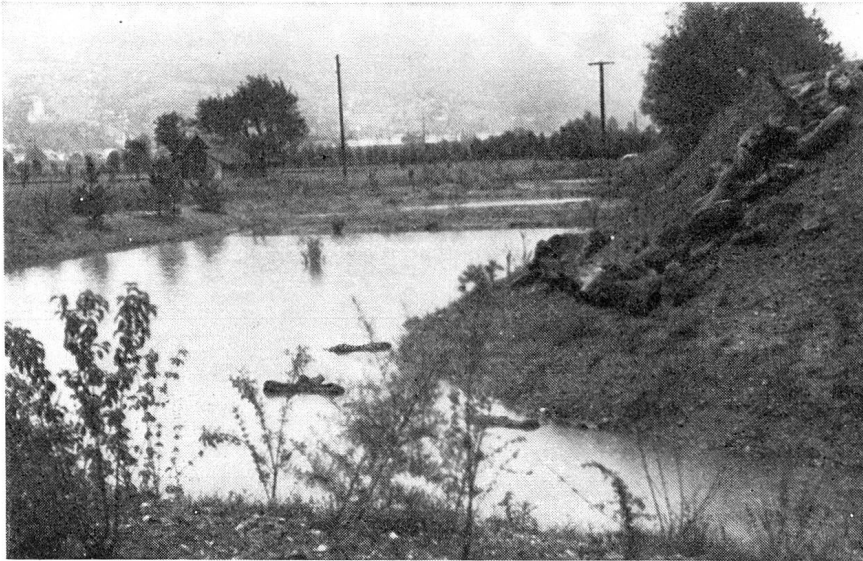
Naturschutzgebiet am alten Vilterser Kiesfang.

Das Querprofil sah eine Sohlenbreite von 6,4 Meter vor und für die Kanalböschungen am Rheindamm eine Neigung von 1:2 und am landseitigen Damm eine solche von 1:1 \frac{1}{2} . Der Rheindamm sollte zu diesem Zweck durch eine 3 m breite Kiesvorschüttung verstärkt und auf der ganzen Länge gegen den Kanal hin mit einer schweren Pflasterung geschützt, ferner Sohle und landseitiger Kanaldamm abgepflastert werden. Die Verlegung der Saarmündung talabwärts bedeutet die Voraussetzung für die reibungslose Entwässerung des gesamten Meliorationsgebietes und die Verhinderung des Rückstaus bei Rheinhochwasser und die damit verbundene Überschwemmung des Kulturlandes.