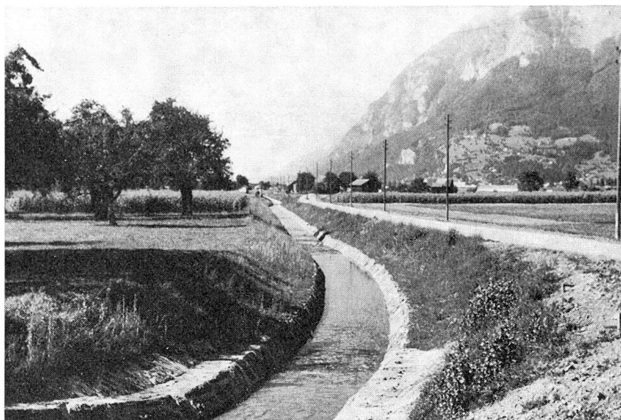
Der neu ausgebaute Saarkanal, unmittelbar nach dem Verlassen des Kiesfanges beim Saarfall.

Abflußverhältnisse schlimmer. Verschiedentlich war der Wasserspiegel in den Kanälen wesentlich höher als 1832. Infolge Drängens seitens des Bahnbaues mußten die Entwässerungskanäle zu rasch erstellt werden, so daß sich bald schon die Nachteile zeigten. Es ergaben sich Unregelmäßigkeiten durch Kiesanhäufungen, welche auf nachlässige und unrichtige Aushebungen zurückzuführen waren. Die Grundursache war aber der zu kleine Querschnitt und die zu geringe Tiefe der Kanäle. Die Gießen (alte Grundwasserläufe) lagen tiefer und führten das Wasser besser ab. So mußten bereits Ergänzungsarbeiten ausgeführt werden. Detailentwässerungen und Güterzusammenlegung blieben aber unausgeführt.