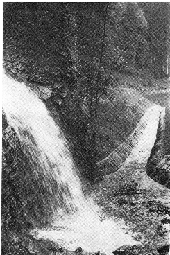
Der Wasserfall der «Kleinen Saar» und deren Ableitung in einer gepflasterten Rinne in den Kiesfang des Saarfalles.

Das Kanalsystem, wie es zur Zeit des Bahnbaues erstellt wurde, mußte den neuen Verhältnissen angepaßt, konnte jedoch in der Linienführung weitgehend beibehalten werden. Für die Detailentwässerung waren die Wasserläufe zu vertiefen und mußten dadurch verbreitert werden. Wo immer möglich, erhielten sie eine Kiessohle und eine Natursteinpflasterung als Uferschutz, sie ermöglichen dadurch das Leben der Fische. Wenn man