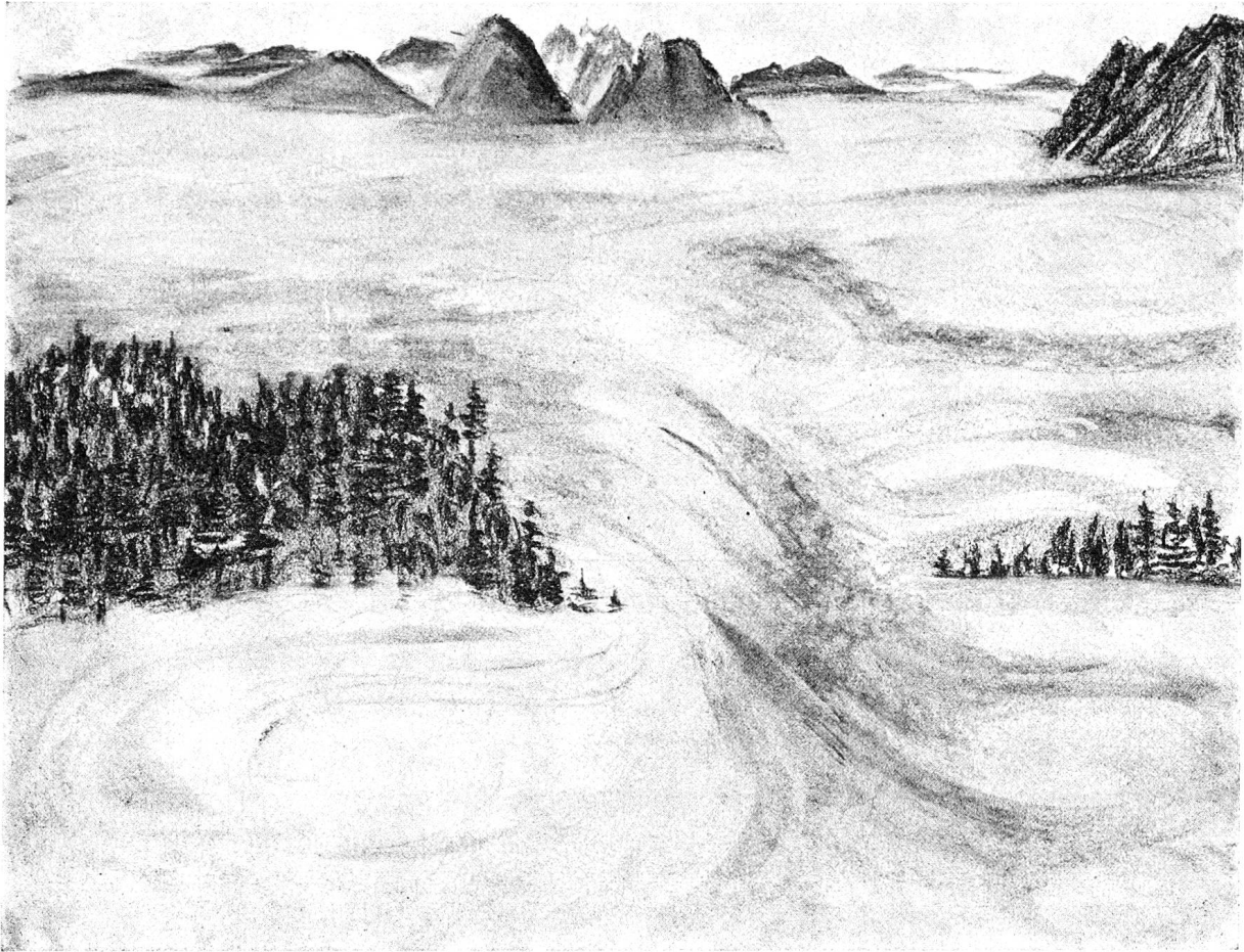
Der sanktgallische Schollberg bei Nebelmeer.

ben wir heute Gelegenheit, ihre alten Wanderwege zu benutzen und herrliche Heimatbilder zu genießen.