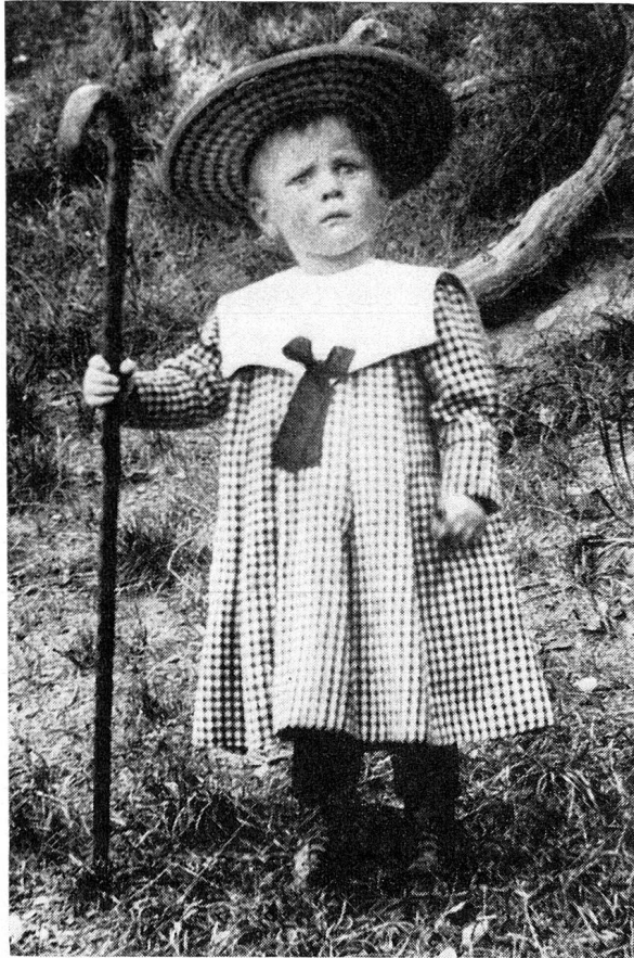
Kinderbild des Verfassers.