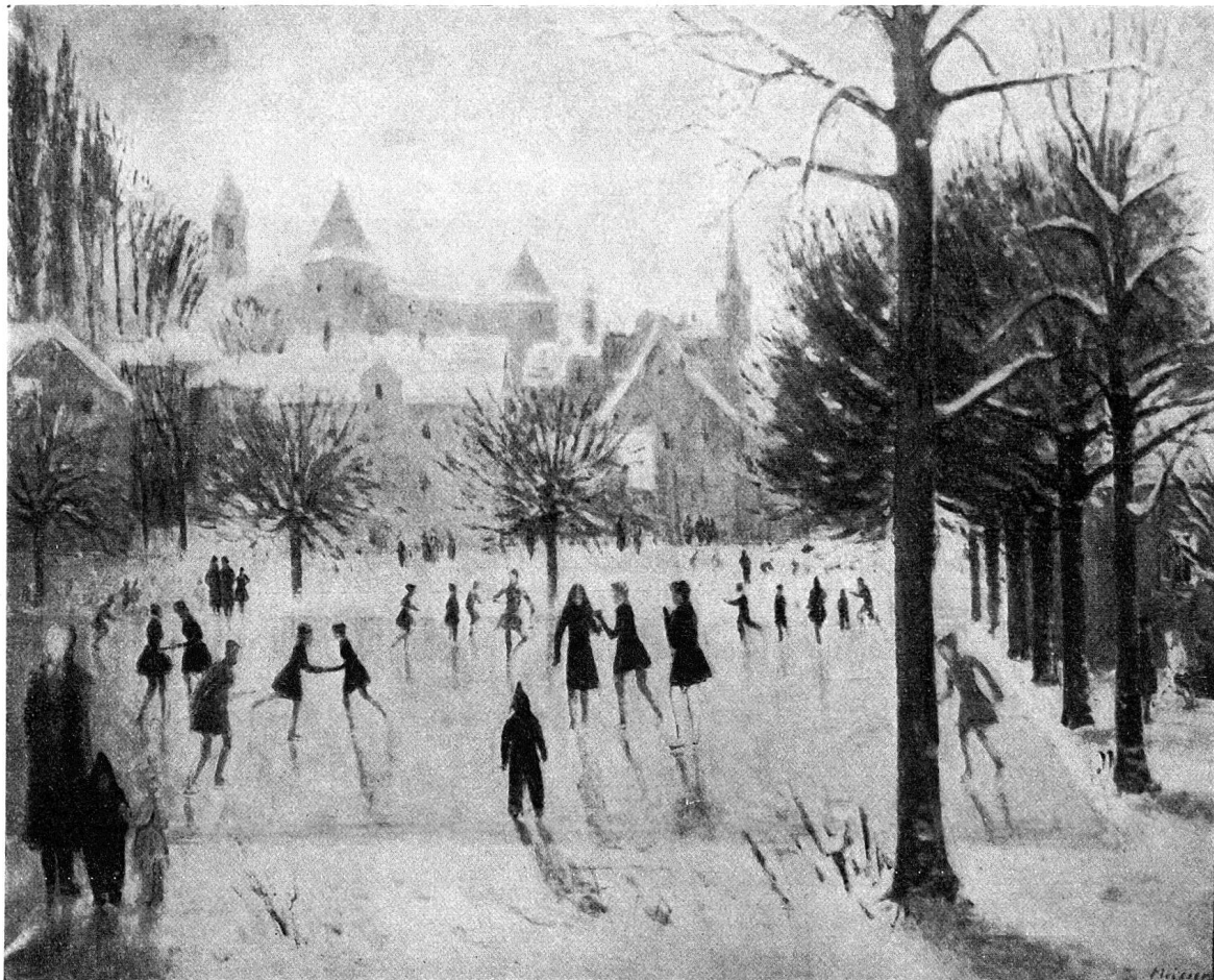
Leonhard Meisser, «Eisfeld auf der Quader», aus der Ausstellung «Die Stadt Chur im Bild» (im Besitz der Kantonalbank).

wurde der Bündner Kunstsammlung vom Künstler geschenkt. Von der Erwerbung einer charakteristischen Büste ist gerade jetzt die Rede, und es ist zu hoffen, daß wir in der nächsten Chronik von der erfolgreichen Finanzierung dieses Ankaufes berichten können.