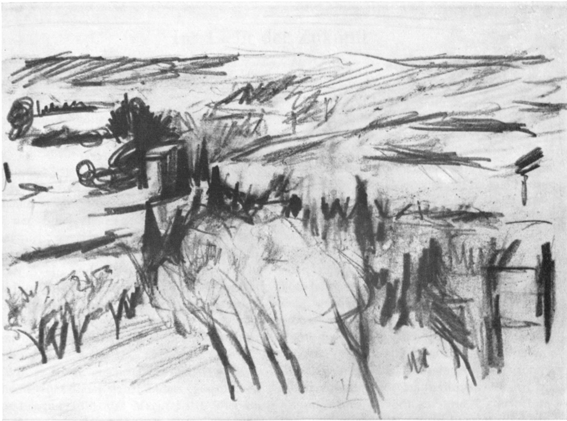
PETER METTIER: PROVENÇALISCHE LANDSCHAFT (IN DER NÄHE VON AVIGNON), BLEISTIFTZEICHNUNG