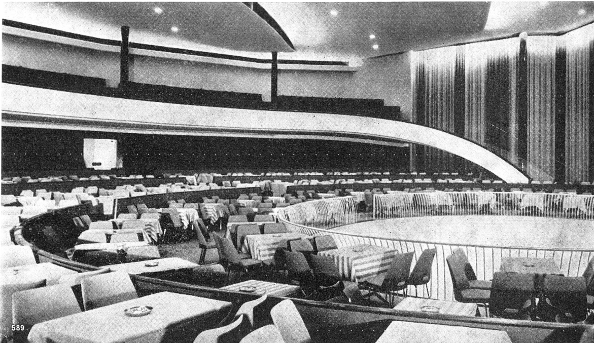
Konzerthalle in einem Kursaal mit Sulzer Lüftungsanlage

Filiale Chur, Quaderstraße 16 Platzmonteure in Arosa, Davos und St. Moritz