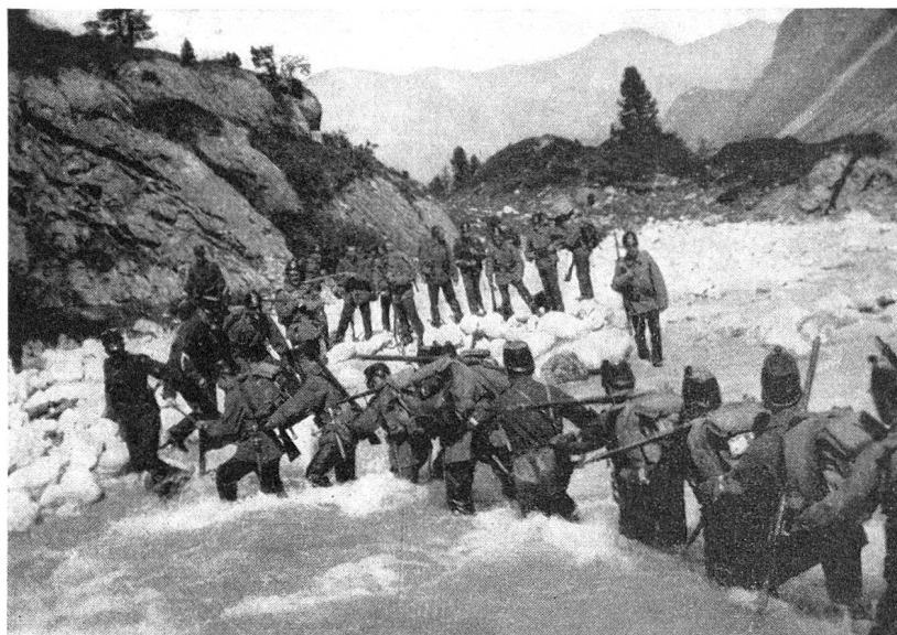
Geb. Inf. Kp. III/91 traversiert die wilde Orlegnia bei Maloja

in Splügen geschliffenes Bajonett mit dem Gewehr aus der Rekrutenschule. Nach 71 Tagen Aktivdienst in Splügen und Umgebung wurden wir entlassen. Aber noch im gleichen Jahr kam das Bat. 91 für 63 Tage nach Maloja. Auch in Maloja begann ein harter Dienst bei eisiger Kälte. Mit Turnen und Marschieren wurden wir aber erwärmt. Hier mußten wir sehr viel Wache stehen. Auch wurden tagelang Schützengräben ausgehoben.