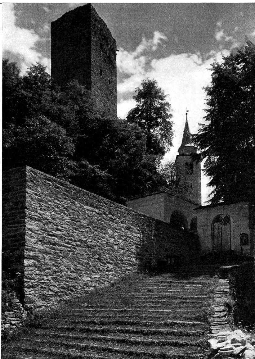
Santa Maria i. Calanca

in der Geschichte gespielt hat. Dieses Land der Vor- alpen, des Hochgebirgs und der Südtäler, des Nationalparks, der Schluchten, Wälder und Bergseen ist unerschöpflich reich an Gegensätzen