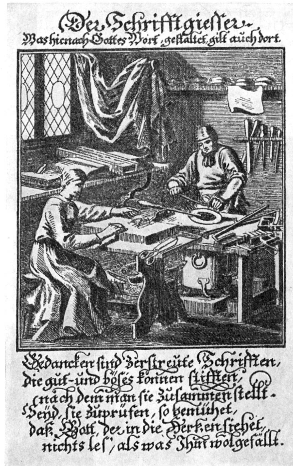
STICH AUS DEM XVIII. JAHRHUNDERT

DIE SCHÖNE DRUCKARBEIT VON BISCHOFBERGER & CO. CHUR BUCHDRUCKEREI UNTERTOR