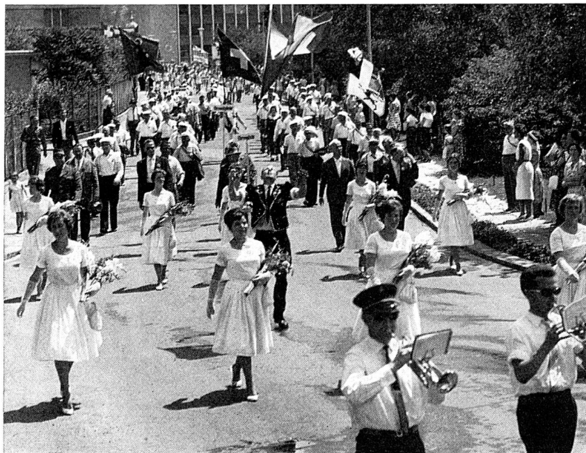
Ausschnitt aus dem Festumzug: Ehrendamen und Ehrengäste an der Spitze

Diesen Veranstaltungen folgten im Festprogramm die Vorführungen der Jungturner, der Frauen und Männerturner, welche auf dem Festplatz bei großem Applaus des trotz der brütenden Sommerhitze recht zahl-