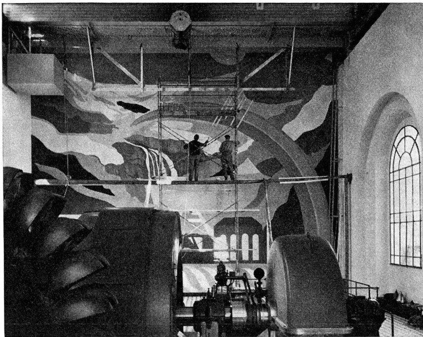
Turo Pedretti: Wandbild in der Zentrale Brusio

Die Rückschau auf die Neuerwerbungen der letzten zehn Jahre zeigt, daß im allgemeinen sehr typische Werke angekauft worden sind und daß es in erster Linie die malerische Qualität war, die bei den Neuanschaffungen den Ausschlag gegeben hat. So stellt die bündnerische Kunstsammlung einen erfreulichen Anfang dar, und es ist ihr zu wünschen, daß sie sich in den nächsten Jahren erheblich erweitern könne und daß ihr bald auch mehr Räumlichkeiten zur Verfügung gestellt werden können, womit ein alter Wunsch aller Kunstfreunde in Erfüllung ginge.