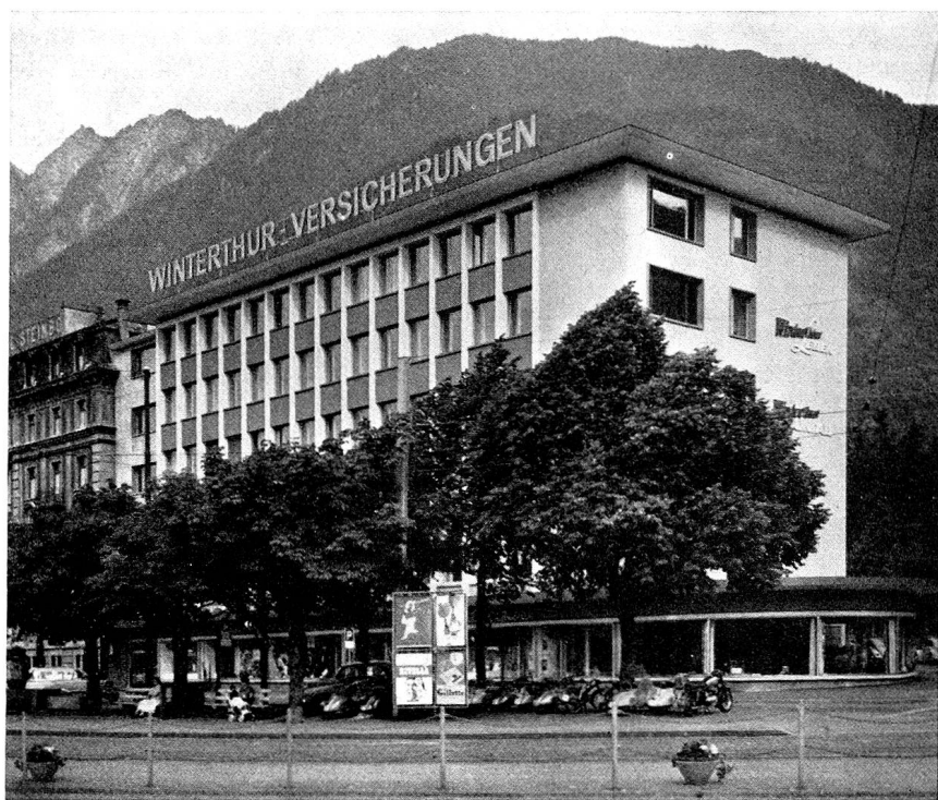
Das neue Verwaltungsgebäude der «Winterthur» am Bahnhofplatz, Chur

Anlage von Kraftwerkbauten. Auch wenn man die Berechtigung, ja Notwendigkeit solcher Bauten anerkennt, fragt man sich nicht ohne einige Besorgnis, wohin diese Entwicklung wohl führt. Andererseits erfüllt es einen mit einer gewissen Genugtuung, wenn man feststellt, daß die maßgebenden Instanzen dieses Problem auch sehen. Anstatt die technischen Anlagen irgendwie zu tarnen und äußerlich in eine Art Palast oder gar Kirche zu verwandeln, wie man dies früher hin und wieder getan hat, ist man heute geneigt, die technisch notwendigen Bauten und Konstruktionen offen zu zeigen; denn diese entbehren ja nicht gewisser ästhetischer Reize, die wir von der Betrachtung moderner Kunst her kennen. Wie gut sich die Welt der Maschinen mit moderner Malerei verträgt, kann ein Beispiel in unserem Kanton eindrücklich bezeugen: der Maschinensaal der Zentrale La Robbia im Puschlav. Die Kraftwerke Brusio AG haben dem Engadiner Maler Turo Pedretti den Auftrag erteilt, ein Wandbild zu schaffen, das von ungewöhnlichen Ausmaßen ist, nämlich 130 m 2 umfaßt. Das Thema lag nahe: die Naturkräfte und ihre Nutzung. Von den Bergen stürzen die Wasserfälle, die im Staubecken gefaßt werden. Unten sehen wir technische Anlagen, über dem Ganzen Wolken verschiedener Dichte und Schwere und einen mächtigen Regenbogen. Mit Recht verzichtet der Künstler auf erzählerische Einzelheiten; denn sein Bild wirkt in erster Linie durch die