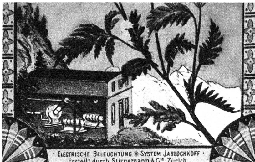
Das erste Elektrizitätswerk von St. Moritz und der Schweiz. Eröffnet 1878

werk «Charnadüra» nicht mehr für die Deckung des Strombedarfes ausreichte. Die «AG» schloß deshalb mit dem EW Madulain einen Energielieferungsvertrag ab. Die bisher freundschaftlich verbundenen Werke gerieten dann aber 1912 in Fehde, weil beide Vertragspartner Anspruch auf die Stromversorgung des neu erbauten Großhotels «Suvrettahaus» erhoben. Die als Aktionärin bei der «AG» beteiligte Gemeinde St. Moritz verweigerte dem EW Madulain die Durchleitungsrechte des Stromes unter Berufung auf ihr absolutes Gemeindemonopol. Das Bundesgericht als letzte Instanz aberkannte jedoch der «AG» das Alleinrecht für die Stromlieferung, worauf das Hotel «Suvrettahaus» endgültig vom EW Madulain mit elektrischer Energie versorgt wurde. Auf Grund dieser Verfügung entwickelten sich nach und nach äußerst unerfreuliche Verhältnisse und ein rücksichtsloser Wettbewerb auf dem Gebiete der Gemeinde St. Moritz beim Anschluß neuer großer Stromverbraucher. 1912 wurde dann von der «AG» das am unteren Ende der Innschlucht stehende, 1887 von Johannes Badrutt gebaute private