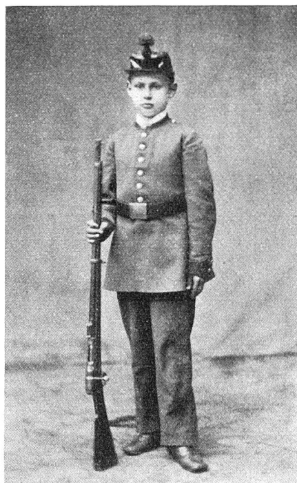
Kadett um 1900

von Oberhalbsteinern, etwa 200—300 Mann. Nun dachte ich, jetzt geht das Tournier erst recht an, und eilte zum Oberthor, durch welches der Zug hereinkommen mußte, um zu sehen, wie er sich geberde und ob nun vielleicht der Moment gekommen sei, um die Sammlung der Eliten unseres Korps anzuordnen. Allein die Leute der alten Verfassung (wie man sie versöhnlichkeitshalber nennen könnte) marschirten, zwar mit