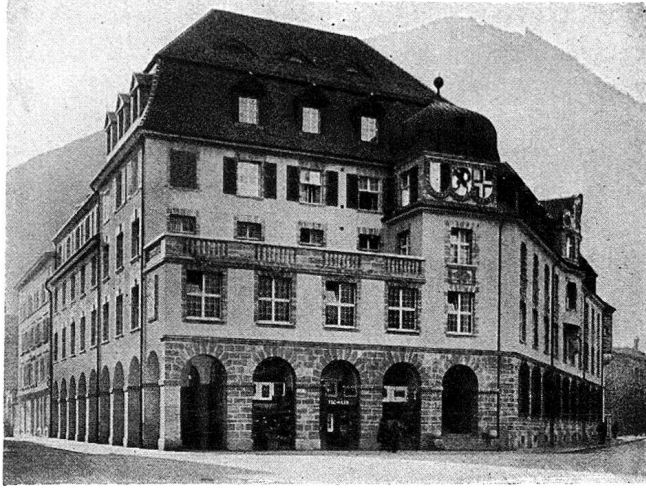
Graubündner Kantonalbank Chur