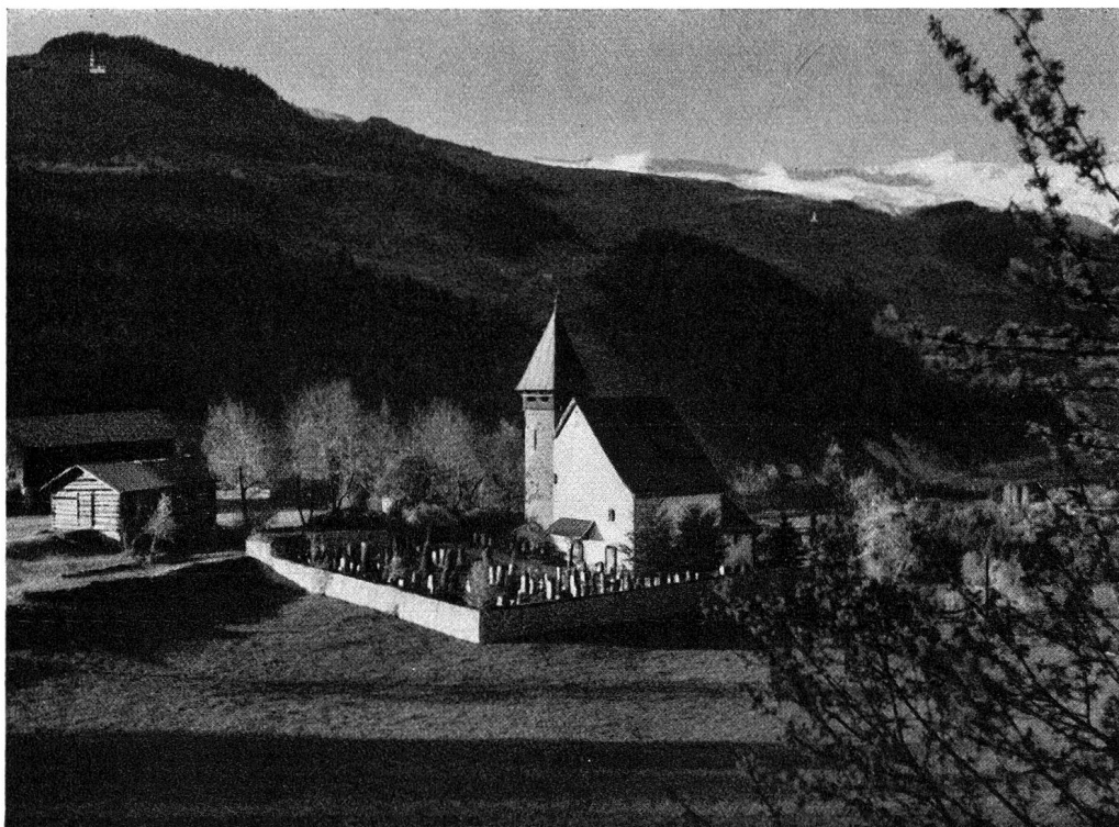
Begräbniskirche zu St. Martin