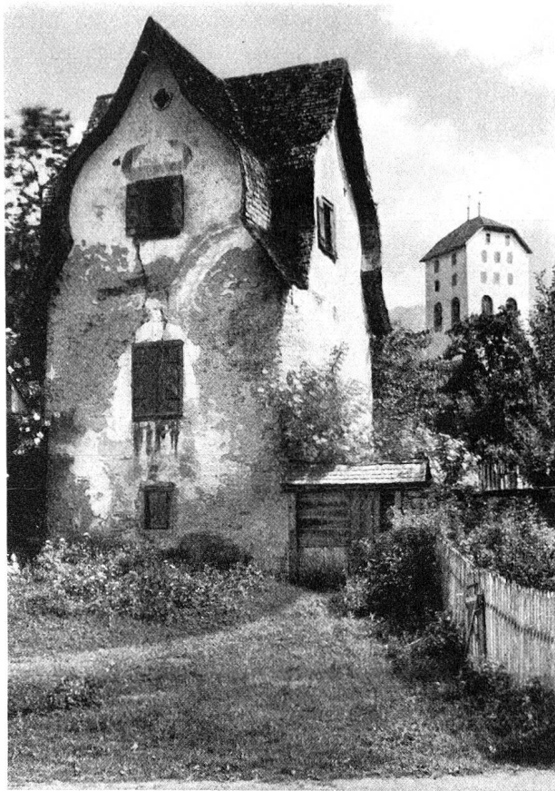
Gartenhäuschen (1710) und Burg Brinegg

beatae Margarete». In den Kämpfen der Grafen von Belmont 1352 wurde auch sie zum Teil ein Raub der Flammen und im Jahre 1483 ganz eingeäschert. Wie die Stadthäuser, so bestand auch die Kirche zum überwiegenden Teil aus Holz. Bereits 1500 ist dann die neue Kirche eingeweiht worden. Heute bewundern wir vornehmlich die sehenswürdigen Gewölbe, die etwas später, nämlich 1518, errichtet worden sind. Der alte Kirchturm am Orte, wo der Hof der Victoriden angenommen wird (Brinegg), hat dank seines massiven Gemäuers dem Brande von 1483 zu widerstehen vermocht. Er