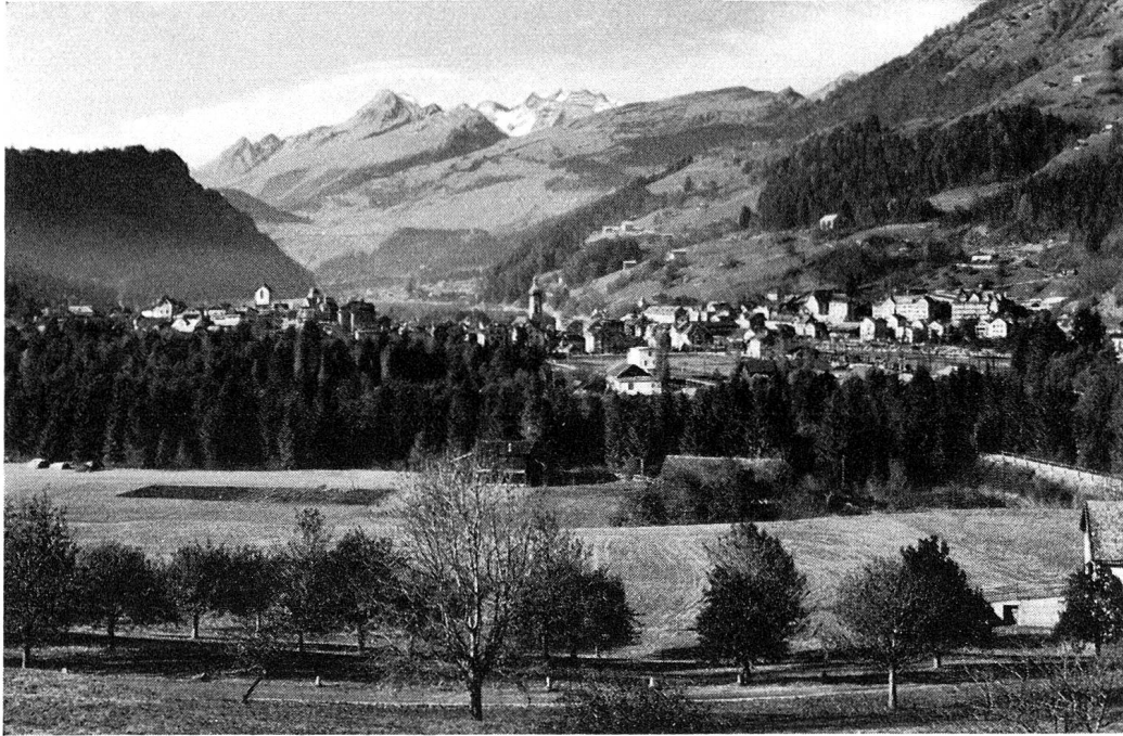
Ilanz mit Brigelserhörnern