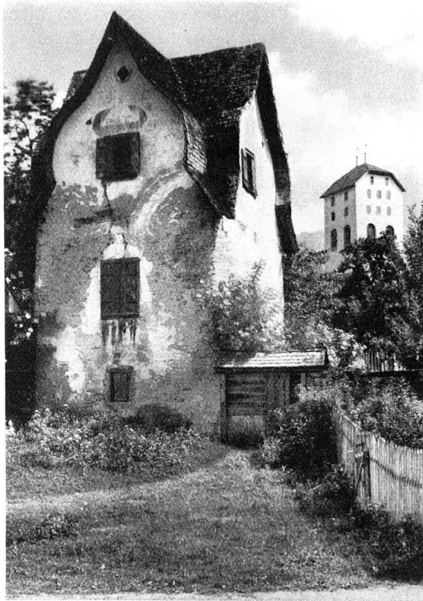
Gartenhäuschen (1710) und Burg Brinegg

beatae Margarete». In den Kämpfen der Grafen von Belmont 1352 wurde auch sie zum Teil ein Raub der Flammen und im Jahre 1483 ganz eingeäschert. Wie die Stadthäuser, so bestand auch die Kirche zum überwiegenden Teil aus Holz. Bereits 1500 ist dann die neue Kirche eingeweiht worden. Heute bewundern wir vornehmlich die sehenswürdigen Gewölbe, die etwas später, nämlich 1518, errichtet worden sind. Der alte Kirchturm am Orte, wo der Hof der Victoriden angenommen wird (Brinegg), hat dank seines massiven Gemäuers dem Brande von 1483 zu widerstehen vermocht. Er