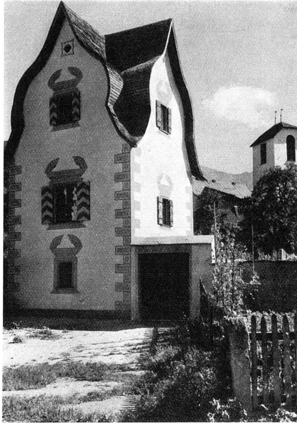
Gartenhäuschen nach der Renovation

Das Obertor steht am Ende der in Zickzackform zweimal gewundenen Hauptstraße im Westen der Stadt und führt nach dem Lugnez (Lumnezia) und nach Obersaxen (romanisch: Sur-saissa). Es war das Gegenstück zum früheren, an der großen Brücke ge-