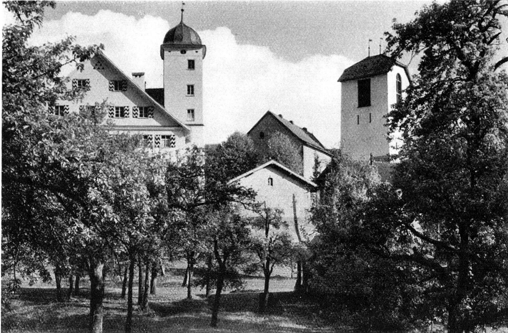
Casa gronda, St. Margarethenkirche und Burg Brinegg

zige im ganzen Gebiet des Oberlandes, die Stirne bieten können. Von St. Nikolaus aus mündet sie wie ein dunkler Tunnel hinaus auf den weiten, prächtigen Platz, wo das bereits erwähnte moderne Ilanz beginnt. Hier ist Neu-Ilanz zuerst aus dem Boden geschossen. Aber in den letzten hundert Jahren sind auch die Glennerstraße, die Bahnhofstraße, Gravas, Bual, Fontanivas, das Gießli entstanden, wo 1484 die große Glocke der St.-Margarethenkirche aus der Schmelze stieg und das heute als Stätte des Viehmarktes dient.