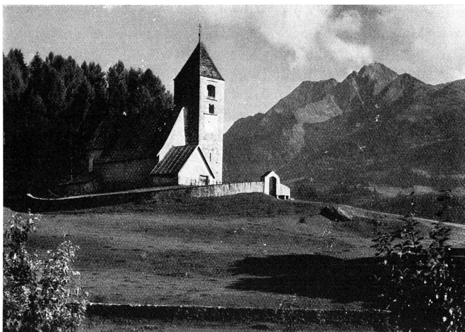
Die alte Kirche Sogn Rumetg in Falera (1491)