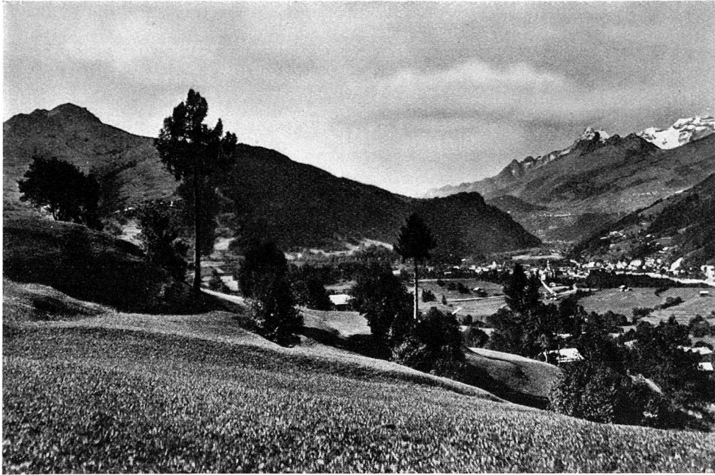
Ilanz mit Piz Mundaun von Sevgein aus gesehen