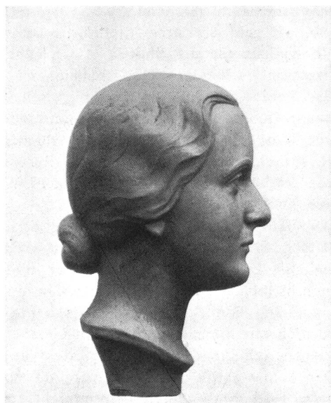
PORTRÄT-KÖPFE U. -RELIEFS FAMILIENWAPPEN · HAUSZEICHEN BIANCHI · BILDHAUER · CHUR

Es begann ein ganz neues Leben nicht nur im Hause des Bachtioni, der seine Kinder aus der Fremde heimrufen konnte, da ihm der Bauer ein bedeutend größeres Gut zum Bewirtschaften übergeben, sondern auch im Heim des Karlismattenbauern, der nicht mehr im Geldzusammenhäufen den höchsten Zweck seines Lebens erblickte, sondern im Gutes tun ebenso große Genugtuung fand.