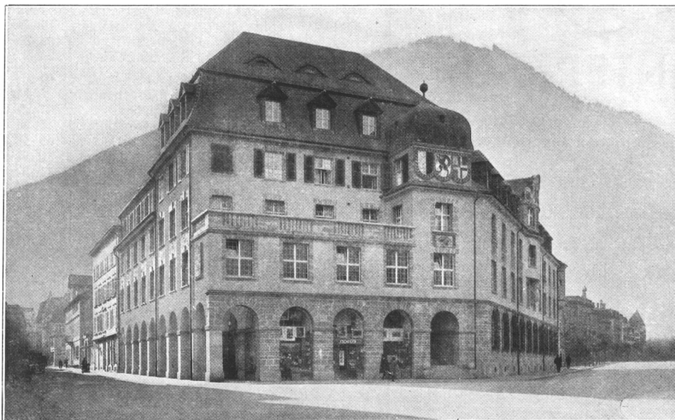
Graubündner Kantonalbank, Chur