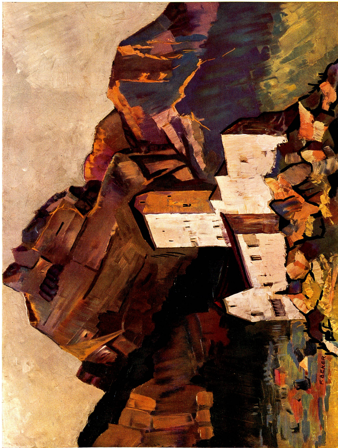
Nach einem Originalgemälde (Spachtelmalerei) von F. Beker