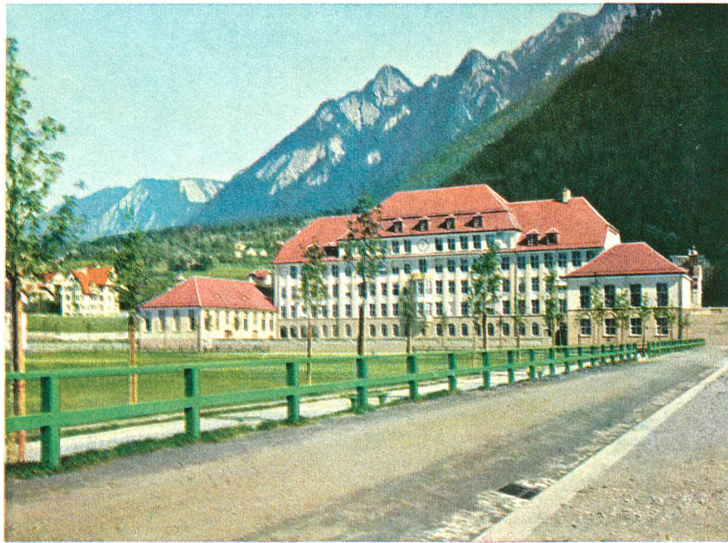
DAS NEUE SEKUNDAR- UND HANDELSCHULHAUS IN CHUR Vierfarbendruck nach Lumièreplatten von der Buchdruckerei Bischofberger ☉ Hotzenköcherle, Chur — Farbenphotographie von Ingenieur J. Danuser, Chur

FREIGESINNT · SICH · SELBST · BESCHRÄNKEND, IMMERFORT · DAS · NÄCHSTE · DENKEND, TÄTIG · TREU · IN · JEDEM · KREISE, STILL · BEHARRLICH · JEDER · WEISE, NICHT · VOM · WEG · DEM · GRADEN · WEICHEND UND · ZULETZT · DAS · ZIEL · ERREICHEND / GOETHE