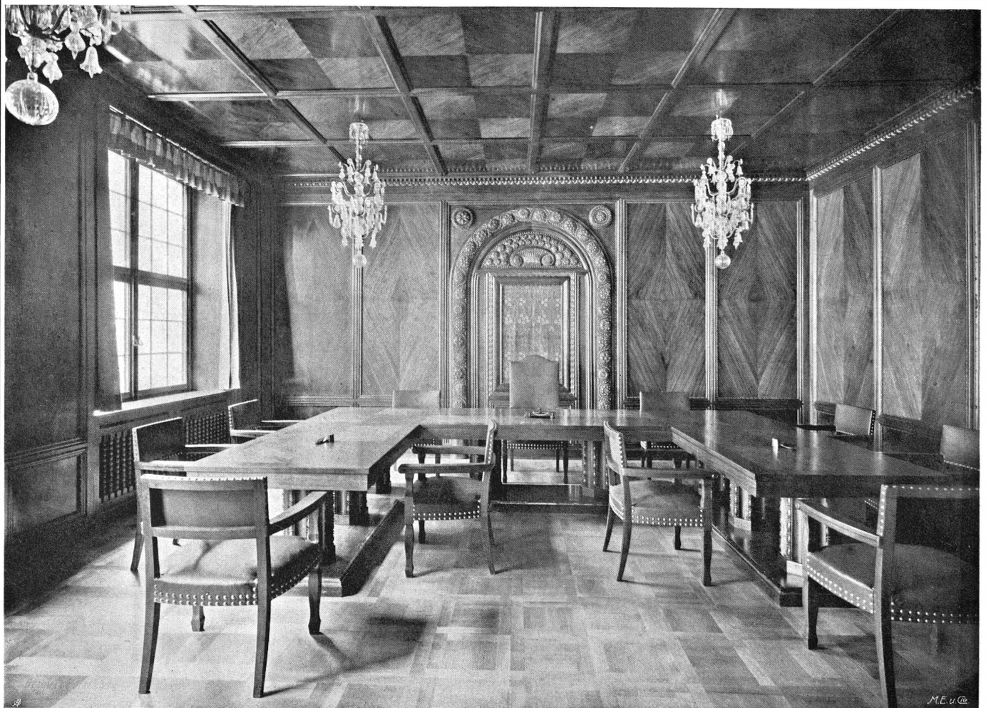
Sitzungssaal der Graubündner Kantonalbank Chur