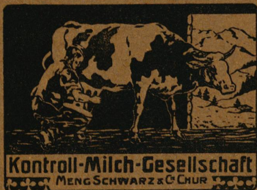
Kontroll-Milch-Gesellschaft MENG SCHWARZ & CO. CHUR

Emmentaler, Tilsiter, Halbfett- u. Mager-Käse