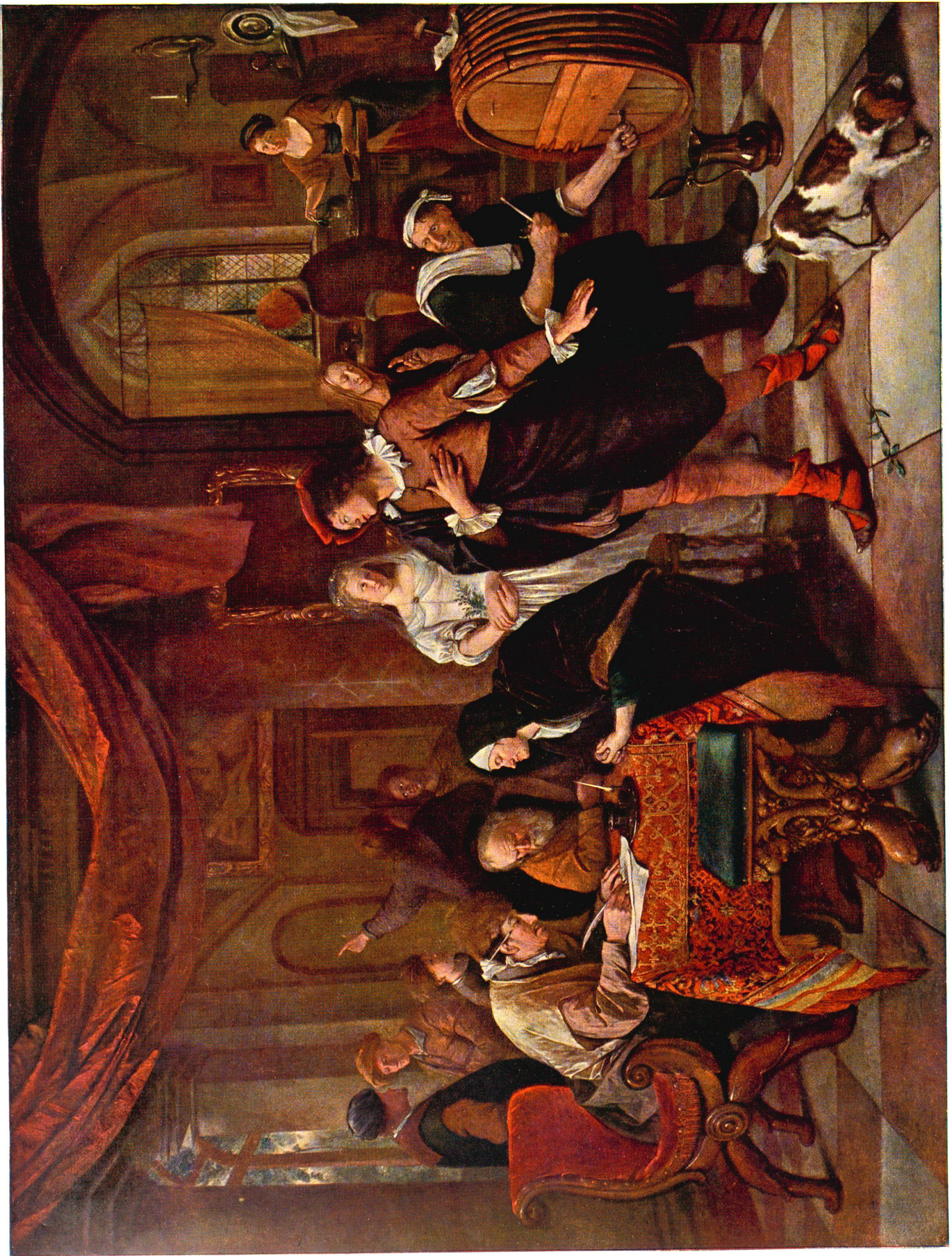
Vierfarbdruck von Bischofberger