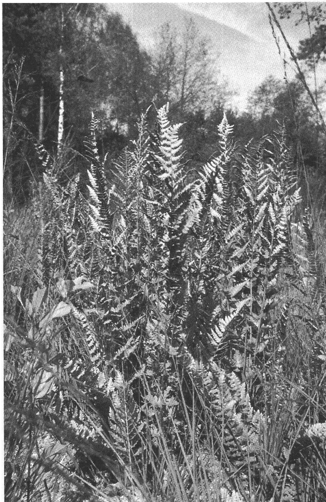
Abb. 2. Fertile Wedel von Dryopteris cristata in offener Vegetation im Wildert bei Illnau-Effretikon, Kanton Zürich.

Aufgrund der im Anhang 1 aufgelisteten Angaben und persönlicher Beobachtungen wächst D. cristata im Gebiet in abgebauten Hochmooren auf torfigen, staunassen Böden in verschiedenen Gesellschaften wie Birken-Föhrenbruchwäldern, Weiden- und Faulbaumgebüsch, nicht zu dichten Landschilfbeständen, Hochstauden- und Großseggenriedern oder offenen Hochmoorresten unterschiedlicher Ausprägung. Außerdem wächst D. cristata in Verlandungszonen auf Schwinggrasen, in lockeren Schilfgürteln und in Erlenbrüchern und kommt im Rheintal auch in Streuwiesen und Buschgruppen in Flach- und Übergangsmooren vor. Dryopteris cristata findet sich meist zusammen mit Sphagnum spp. und oft in der Nähe von Frangula alnus . Die Sporophyten sind an schattigen Standorten meist klein und steril, im Halbschatten hingegen hochgewachsen mit einigen fertilen Wedeln. Bei starkem Lichtgenuß am Rand von Buschgruppen oder in offener Vegetation entwickelt D. cristata oft große Fertilität (Abb. 2).