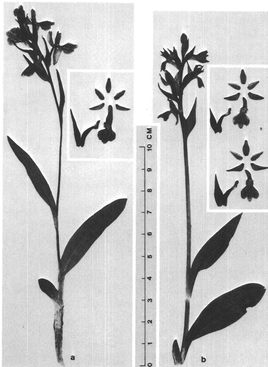
Abb. 2. Dactylorhiza lapponica . a Kt. Glarus: Elm, Nideren 30. 7. 1986, HR 386034 (Z) – b Kt. Glarus: Garichti-Stausee, 13. 7. 1986, HR 386032 (Z)

die lockerblütige Infloreszenz gemahnen an D. traunsteineri ; die manchmal ziemlich breitlanzettlichen, stark gefleckten Laubblätter und der dickliche, hohle Stengel repräsentieren die Tendenz zu D. majalis .