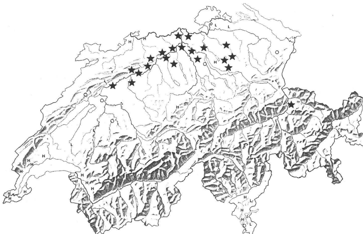
Abb. 2. Fundgebiete von Leontodon saxatilis in der Schweiz. Karte aus Welten und Sutter (1982), erweitert. Leere Kreise: in der betreffenden Kartierfläche selten, L: Literaturangabe, H: Herbarbeleg, Sterne: neue Vorkommen.

L. saxatilis ist eine Pflanze westeuropäisch-westmediterraner Herkunft. Als Standorte werden Brachfelder, Ufer und Wegränder in der kollinen Stufe mit offenen, nährstoffreichen Böden genannt. In der Schweiz wurde die Art bisher vor allem im Südwesten und auf der Alpensüdseite, an vereinzelten Stellen auch in der Nordschweiz gefunden. Die allermeisten Vorkommen gelten jedoch als erloschen und sind nur noch durch altes Herbarmaterial oder Literaturangaben belegt. Die jetzigen Neufunde lassen aber vermuten, daß die Art heute in der Nordschweiz in älteren, moosreichen und oft auch beschatteten Kunstrasen sehr verbreitet ist (vgl. Abb. 2). Melzer (1984) beobachtete sie auch längs schweizerischer Autobahnen mehrmals.