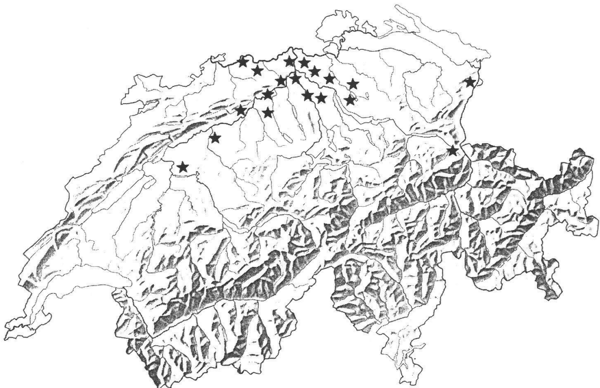
Abb. 3. Fundgebiete von Panicum dichotomiflorum in der Schweiz. Sterne: Vorkommen in der betreffenden Kartierfläche, vgl. Welten und Sutter (1982).

Es ist erstaunlich, daß P. dichotomiflorum in Schweizer Botanikerkreisen trotz seiner Häufigkeit und weiten Verbreitung (Abb. 3) bis heute weitgehend unbeachtet blieb und auch im Verbreitungsatlas gänzlich fehlt. In der Landwirtschaft ist die aus Amerika stammende Art seit 20 Jahren bekannt, nachdem sie im Jahre 1971 erstmals in einem Maisacker bei Uster (Kt. Zürich) in einem größeren Bestand beobachtet wurde (Marshall 1973). Nach Hegi (1935) trat P. dichotomiflorum bereits früher einmal in Derendingen (Kt. Solothurn) auf, als es mit Wolle aus Argentinien nach Europa eingeschleppt wurde. Ein entsprechender Beleg vom 17. 9. 1932, leg. R. Probst, wurde tatsächlich im Herbarium der Universität Zürich (Z) gefunden. Die Pflanze hat einen wesentlich feine-