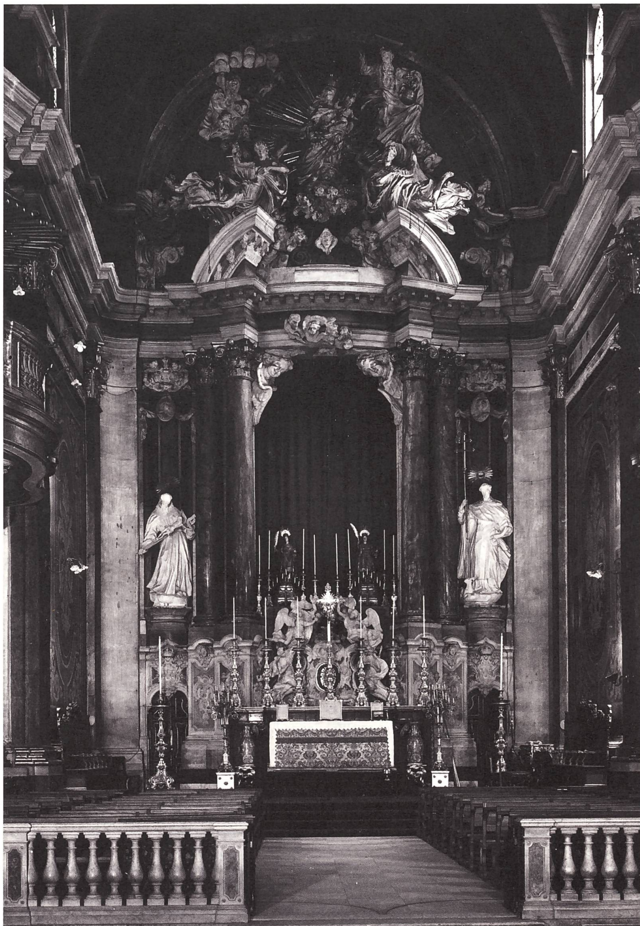
Cappella principale della Chiesa di San Domenico, Lisbona (prima dell'incendio del 1959). João Frederico Ludovice (architetto) e Giovanni Antonio Bellini (scultore), 1748.