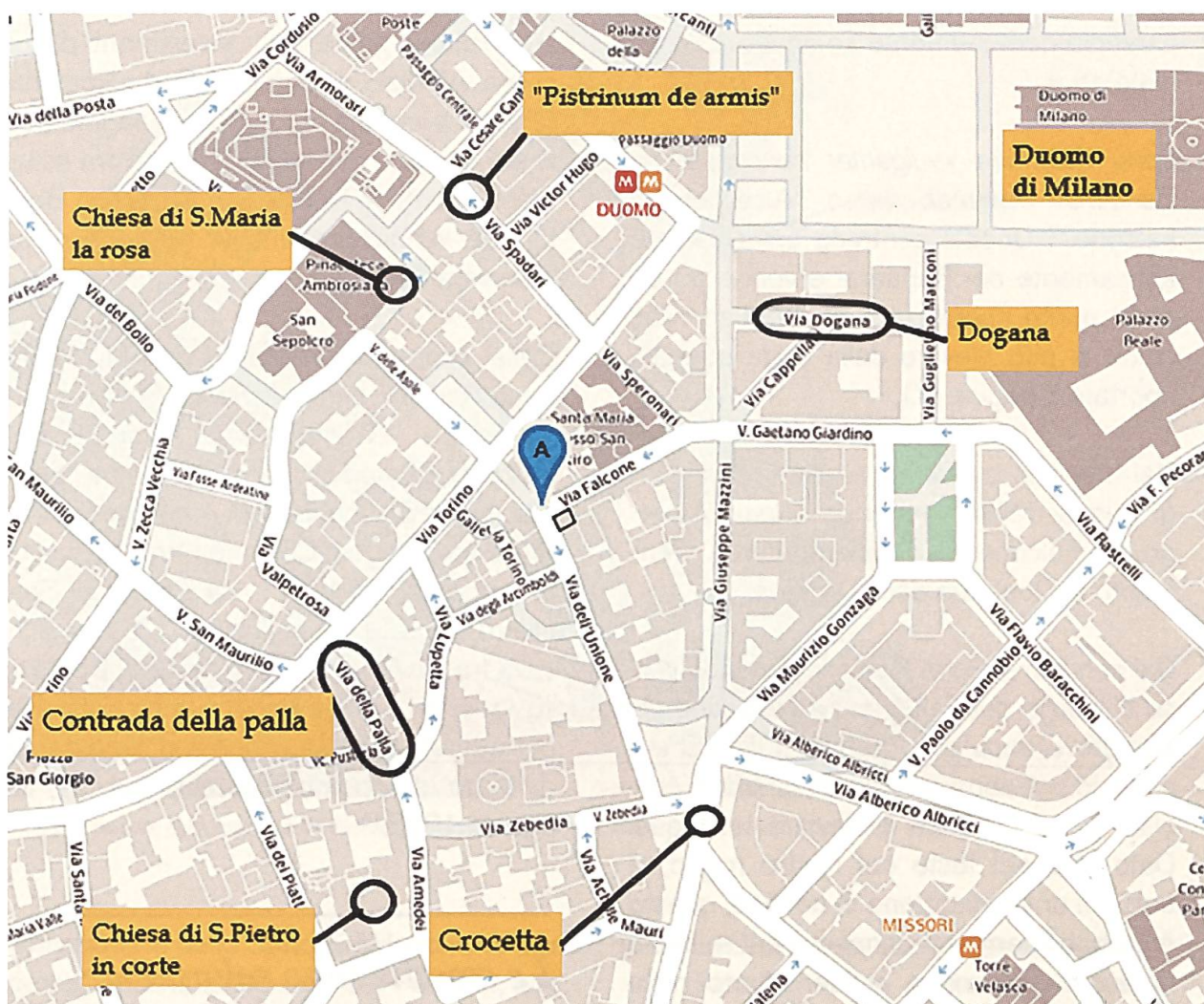
Immagine parziale della mappa della Milano odierna.

quale non era consentito aprire nuove attività commerciali concorrenti con quella dell'Albergo del Falcone.