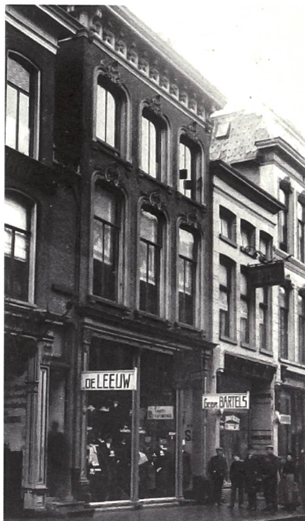
Fig. 8 Sede della ditta «Balli, Selva & Co.» situata al n° 328 della Heerestraat (2ª da destra).