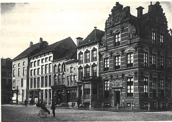
Fig. 4 La locanda De Daniël (2ª da sinistra) al Grote Markt.