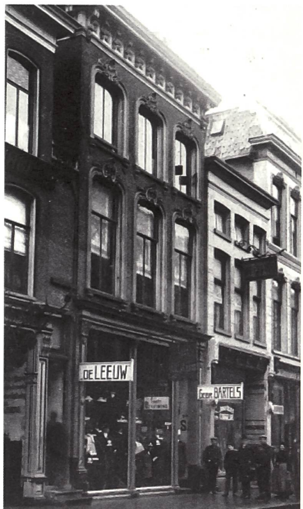
Fig. 8 Sede della ditta «Balli, Selva & Co.» situata al n° 328 della Heerestraat (2ª da destra).