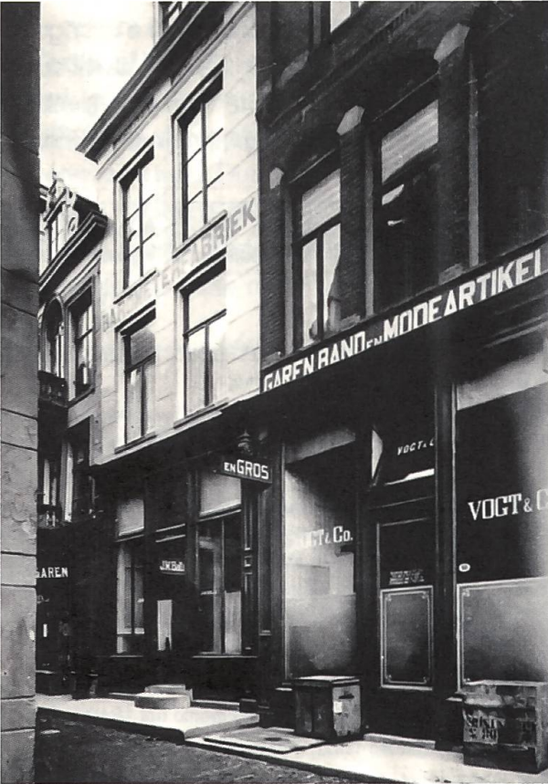
Fig. 5 La fabbrica di barometri Balli al Vismarkt n° 8.