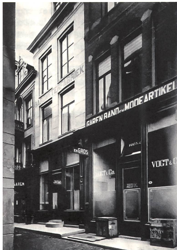
Fig. 5 La fabbrica di barometri Balli al Vismarkt n° 8.