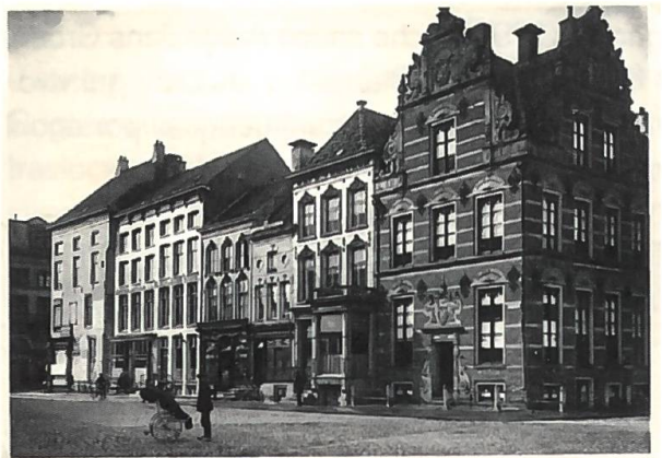
Fig. 4 La locanda De Daniël (2ª da sinistra) al Grote Markt.