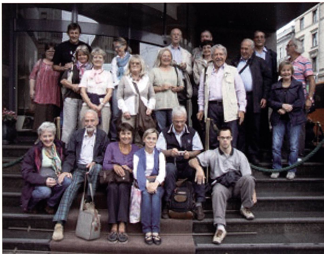
San Pietroburgo, il nostro gruppo davanti all'albergo