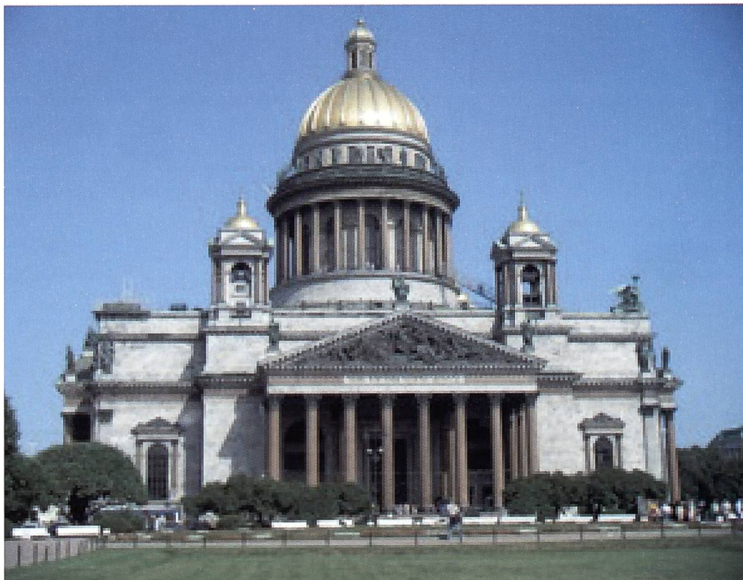
Cattedrale di Sant'Isacco, San Pietroburgo