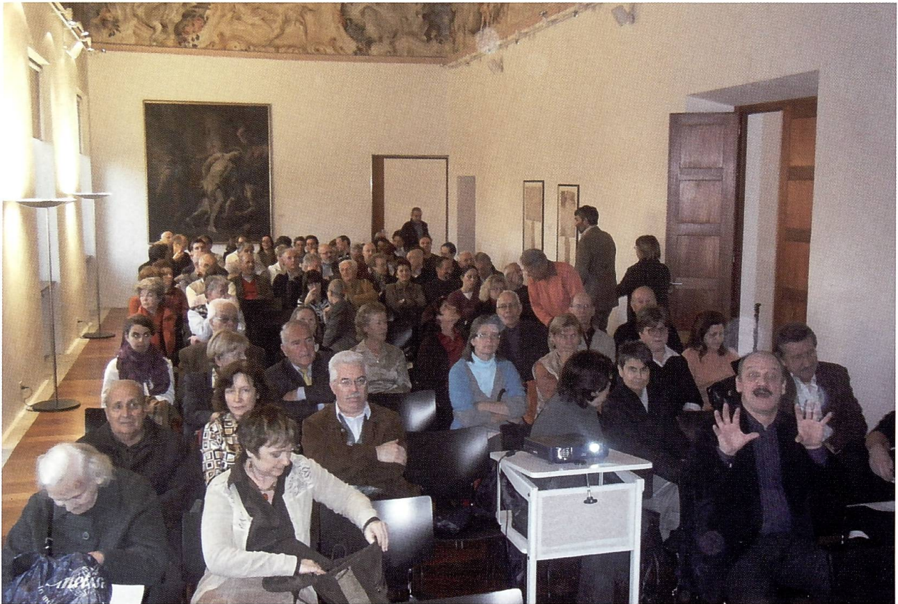
Due immagini del pomeriggio genealogico a Balerna del 15 novembre 2008