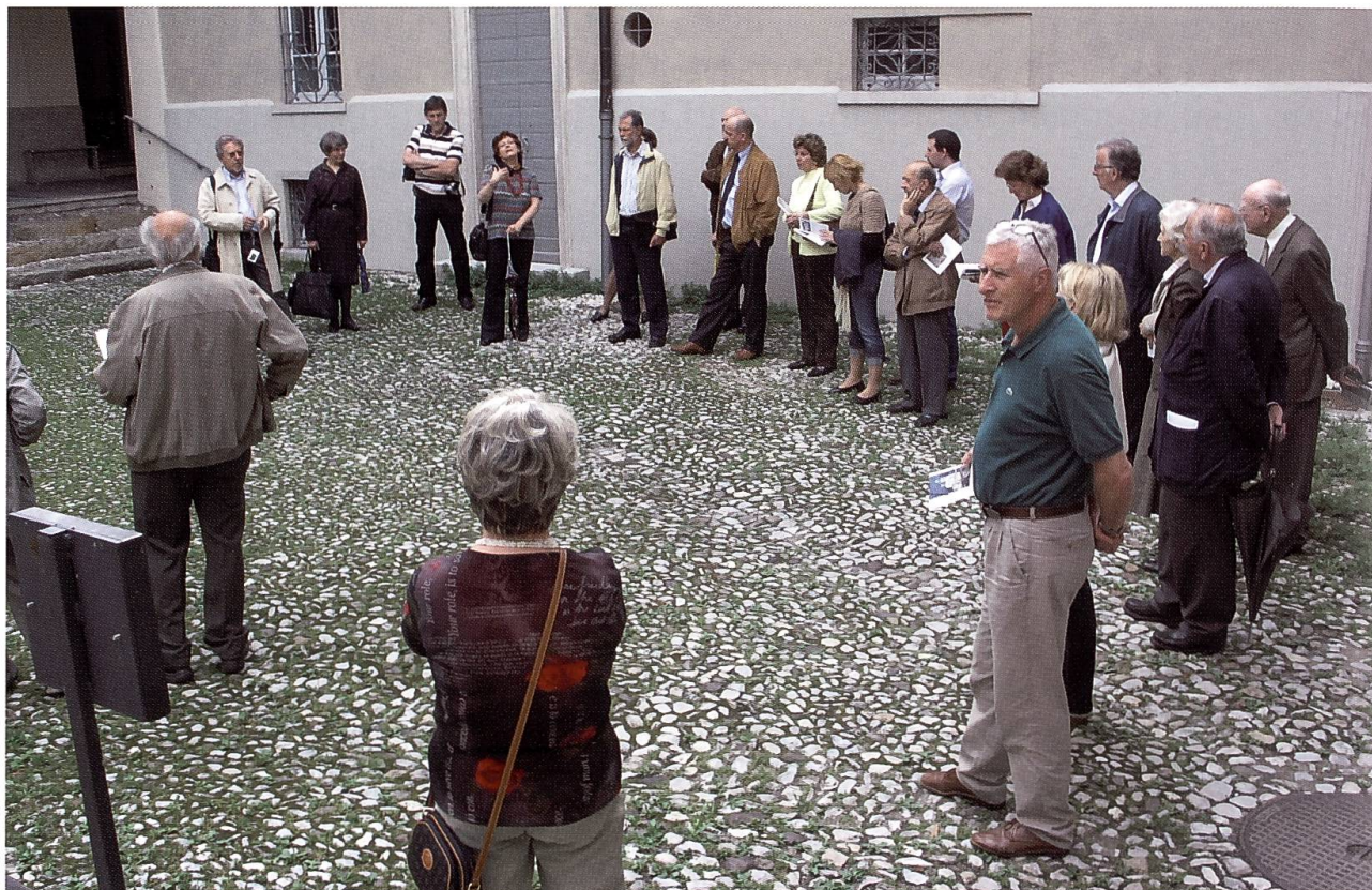
Alcuni dei partecipanti all'assemblea di Riva San Vitale del 31 maggio 2008