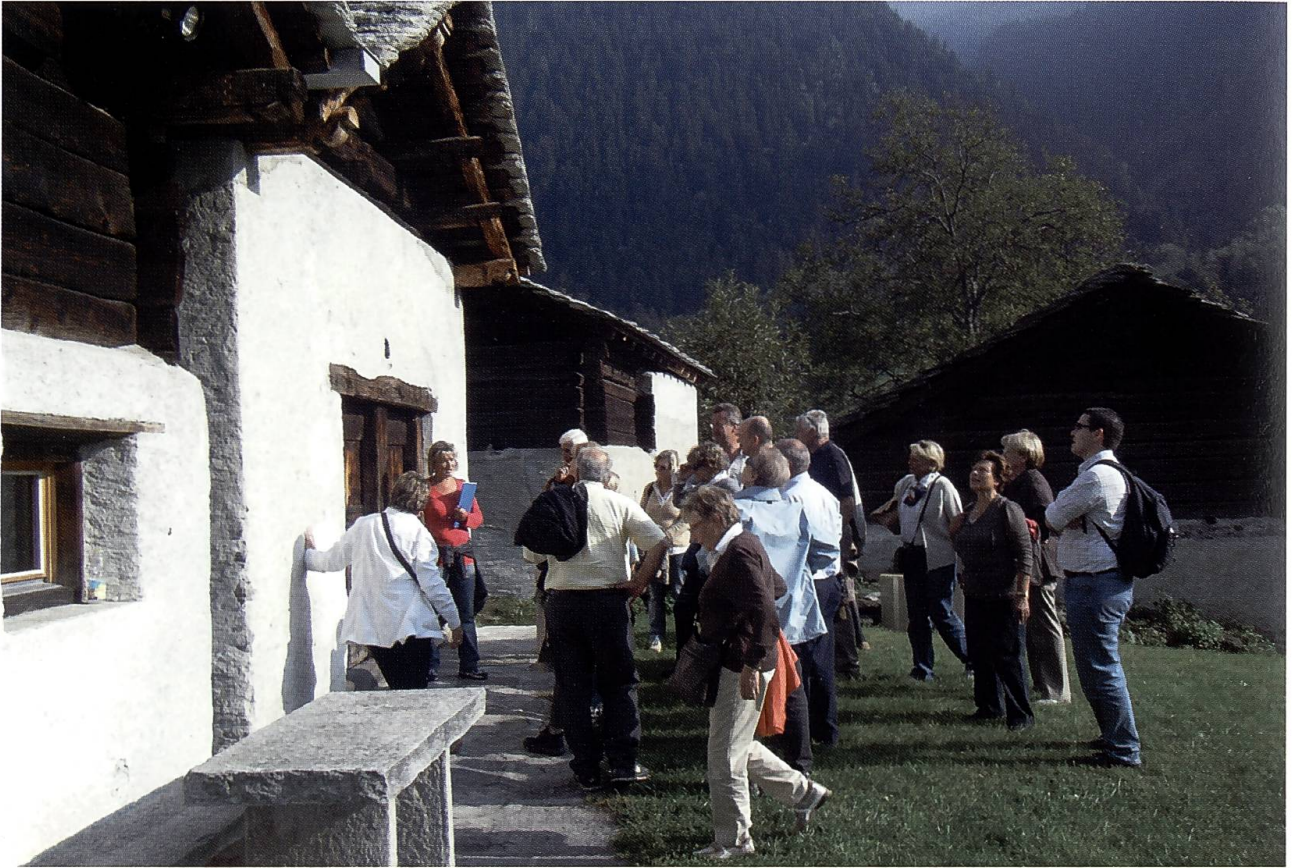
Due immagini della gita in Bregaglia del 15 settembre 2008