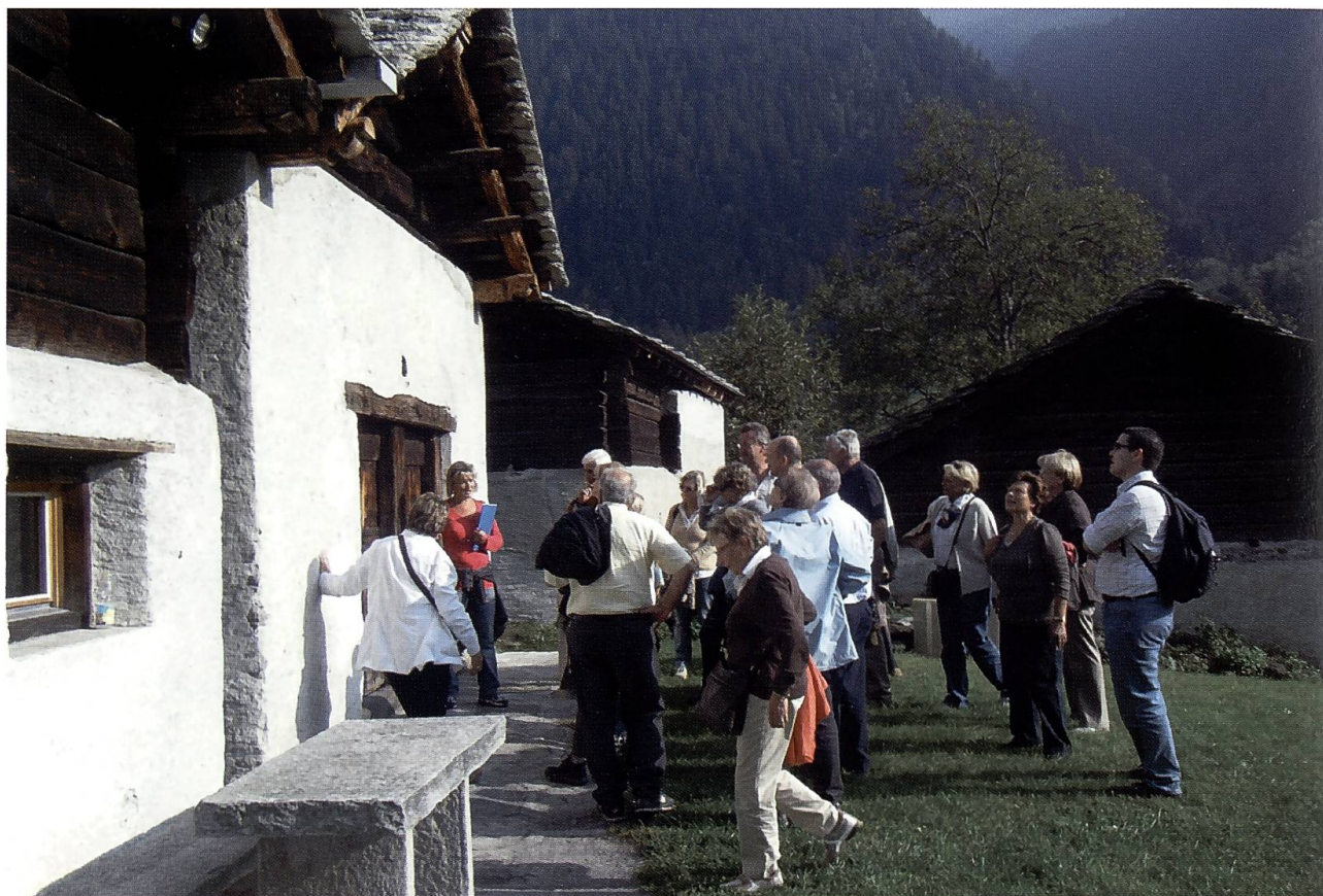
Due immagini della gita in Bregaglia del 15 settembre 2008