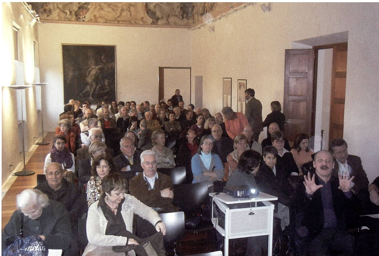
Due immagini del pomeriggio genealogico a Balerna del 15 novembre 2008