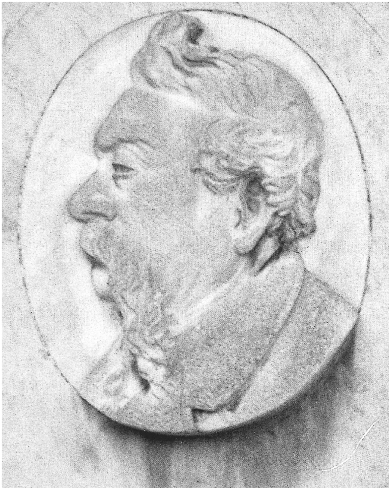
Ritratto di Giacomo Berra (* Certenago 1808/1809 - † Certenago 1881). Tomba della famiglia Giani-Berra, nel Cimitero di Sant'Abbondio (Gentilino).