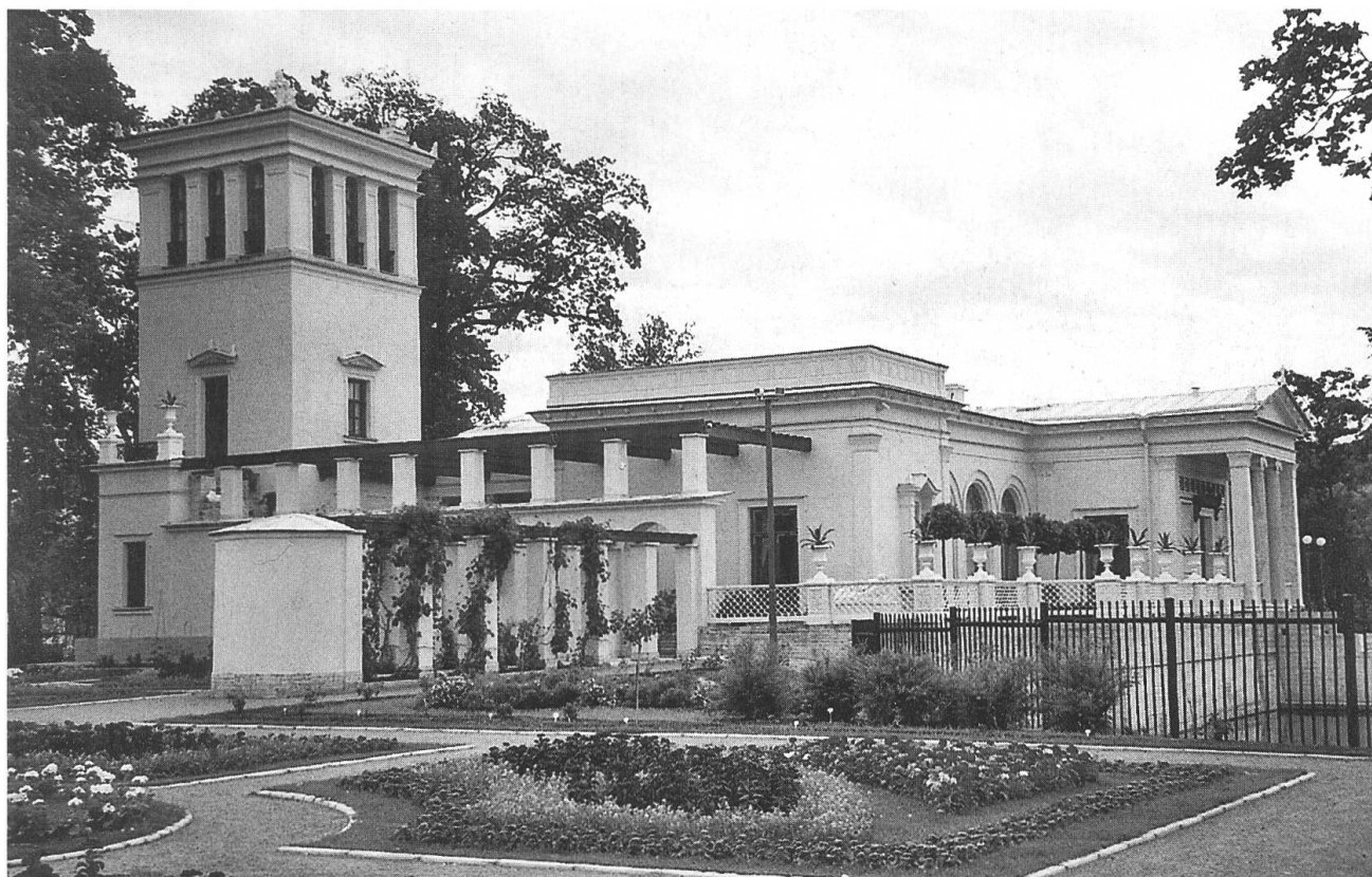
Peterhof. Padiglione detto «pompeiano» sull'Isola della Zarina. Facciata meridionale vista dal laghetto. Fotografia di A. Mario Redaelli, giugno 2006.