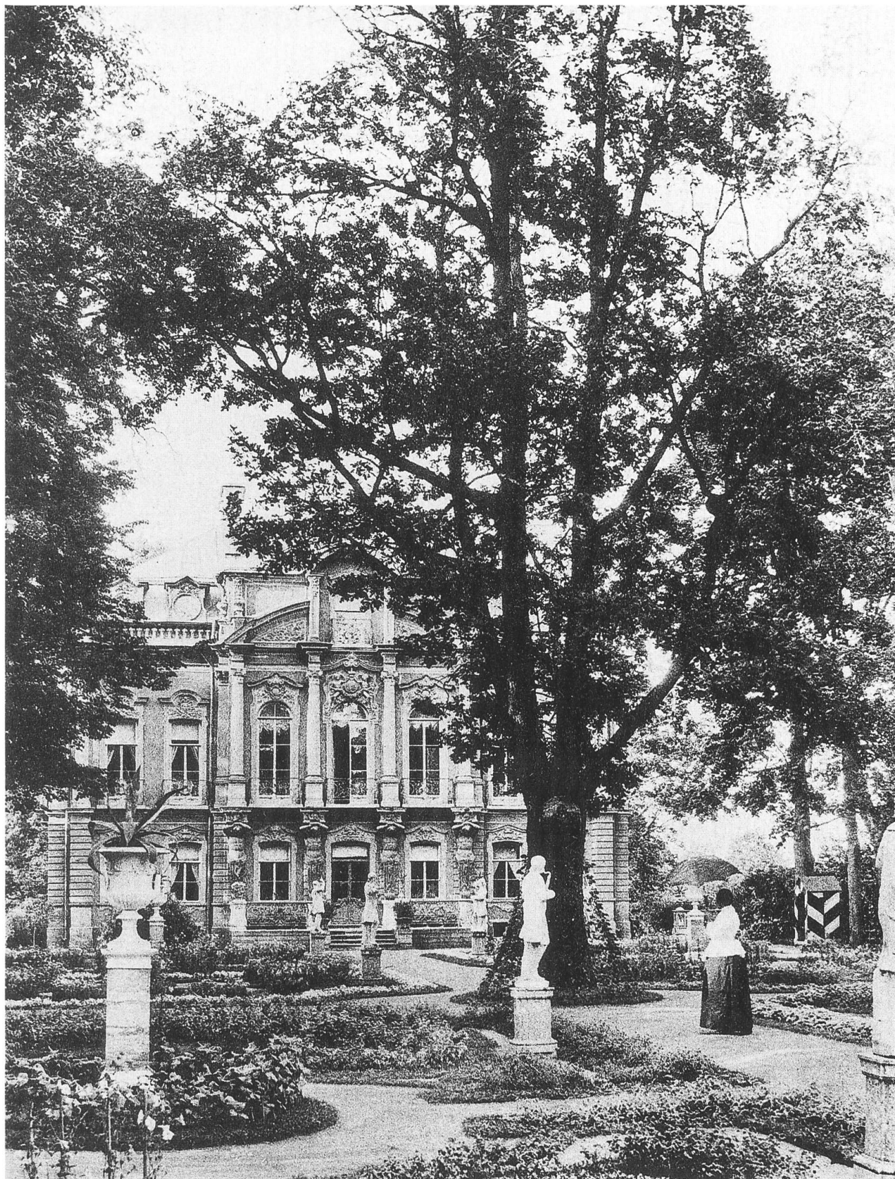
Peterhof. Dacia privata imperiale nel parco, sulla strada Peterhof-Oranienbaum. Archivio fotografico dell'Istituto per la Storia della Cultura Materiale, presso l'Accademia Russa delle Scienze (IIMK RAN). San Pietroburgo. Foto di E. P. Visnjakov, 1894.