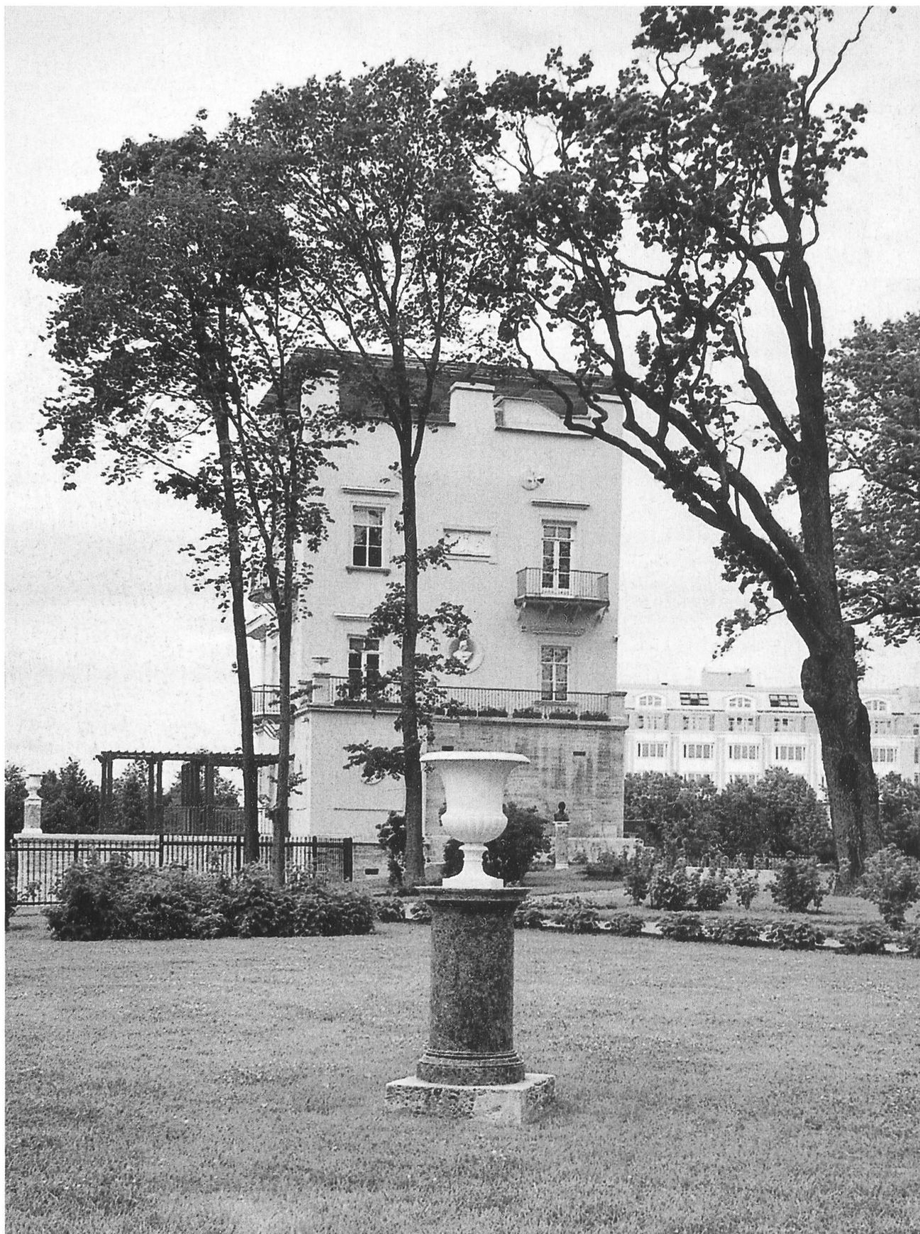
Peterhof. Padiglione di Olga. Foto di A. Mario Redaelli, giugno 2006.