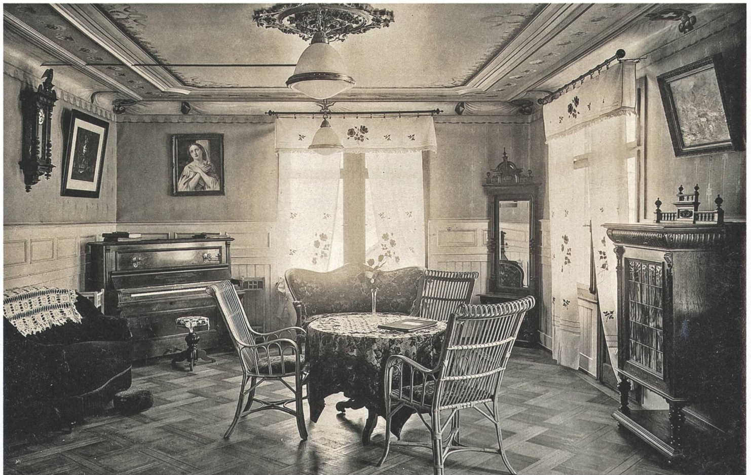
Damensalon des Kurhaus Engel in Niederrickenbach: Typisches Interieur der Belle Époque, wie es in der Nachkriegszeit mehr und mehr aus der Mode kam.

jedes Jahr im Sommer wieder an. Die Pension Schützenhaus in Stansstad war ein solcher Mittelstandsbetrieb. Das 1905 eröffnete Haus konnte bis 1914 bereits auf eine treue Stammkundschaft zählen. Gemäss Gästebuch stammten die meisten Gäste aus Deutschland (von 1911 bis 1913 durchschnittlich 45%), danach folgten die Elsässer (23%) und die Schweizer (18%). 10 Wie sich später zeigen sollte, half diese Ausrichtung auf den Mittelstand nach dem Krieg entscheidend mit, die darniederliegende Branche wieder aufzubauen. Im Gegensatz dazu konnten die noblen Palast-Hotels der Belle Époque nicht mehr an ihre einstige Bedeutung anknüpfen – eine Entwicklung, die in der ganzen Schweiz zu beobachten war.