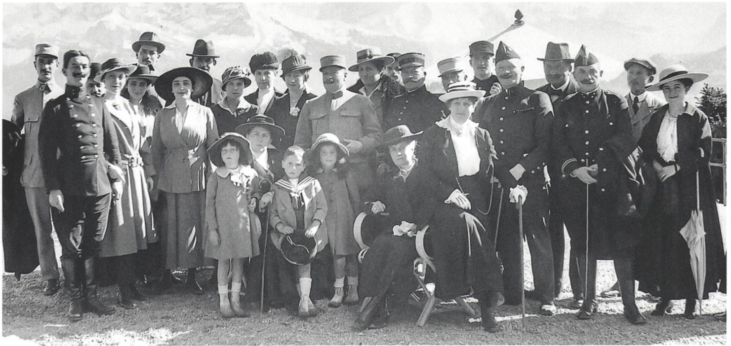
Die Internierten waren auch als Ausflugsgäste wichtig für den Tourismus: Besuch von französischen (Schirmmützen) und belgischen (Policemützen) Offizieren mit ihren Familien auf dem Stanserhorn.

Butter ein – dies sei «für die Auswärtigen eben sehr verlockend» gewesen. 41